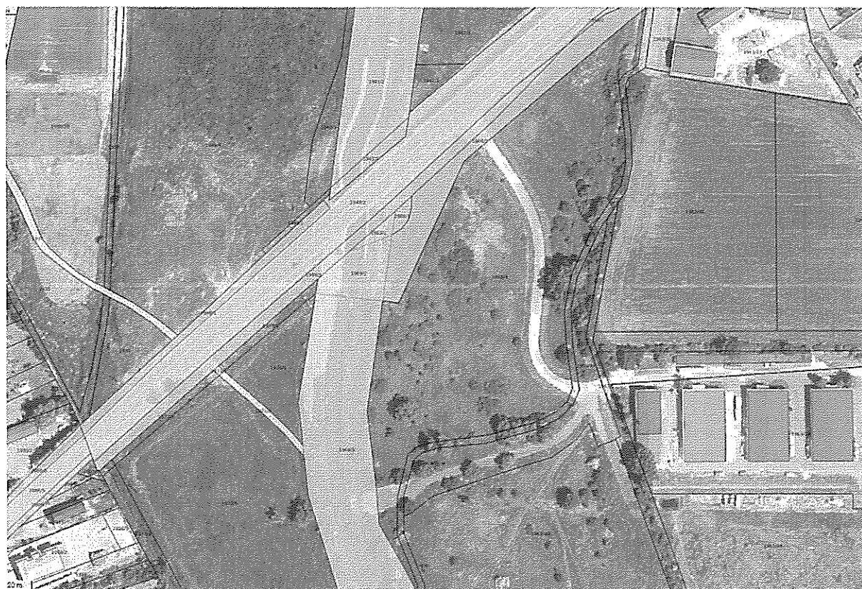
Ingalanra vonatkozó szabályozási tervi kivonat: