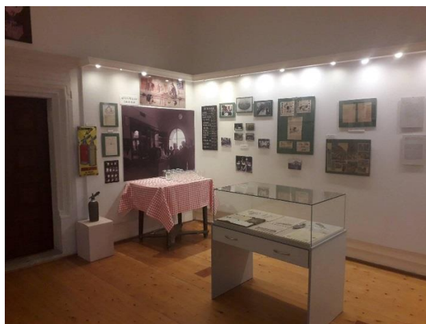
Góré Szabina kiállítása, Zempléni Fesztivál – 2020. augusztus 15- 2020. szeptember 30.