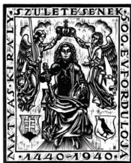
MÁTYÁS KIRÁLY SZÜLETÉSÉNEK 500. EVFORDULÓJA · 1440–1940 Mátyás két angyal között, koronával, címerekkel a bauxitzi dombormű alapján 198 × 160 mm. (kicsinyítve) 0038 / 1940