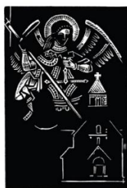
A MARGITSZIGETI SZENT MIHÁLY KÁPOLNA Befejezetlen 145 × 97 mm. (kicsinyítve) 2081 / 1993