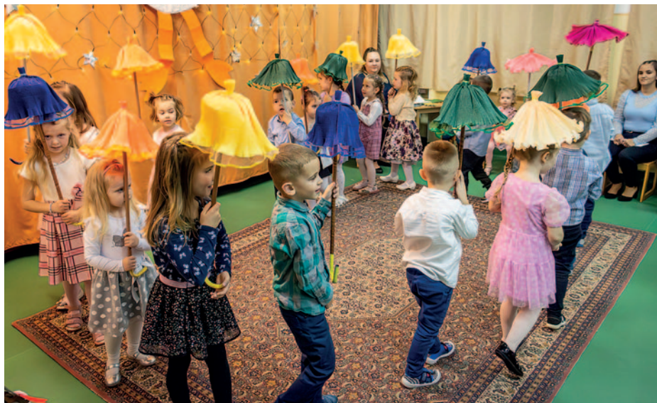
A Csalogány csoport Márton-napi ünnepsége

A Szerencsi Óvoda és Bölcsőde Gyárkerti épületének Csalogány csoportja november 12-én Márton-napi ünnepséggel készült a szülők és meghívott vendégek számára.