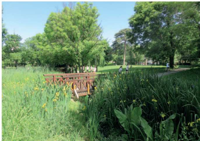
A várkert 2021-ben

és a vásártér átalakítása, mely egy harminc éve készült vázlatterv több lépcsős megvalósulását jelenti, a töredezett aszfaltos, sivár és lepusztult vásártér fásított rendezvénytérré alakításával együtt. Ezen kívül az un. „R” épület és a volt ÉMÁSZ iroda felújítása, és az iskolák körüli futókör építése is megtörtént. Ez utóbbi eredménye a kerítések egy részének elbontásával a járdák szélesítése, és újabb zöldterületek megnyitása a közösségi használatnak. A folyamat eddigi zárásaként említhetjük az idén elkészült katolikus óvodát, amely a volt plébánia épületének bővítésével jött létre, és amely lehetőséget adott a Deák utcai útburkolat és járda szélesítésére is.