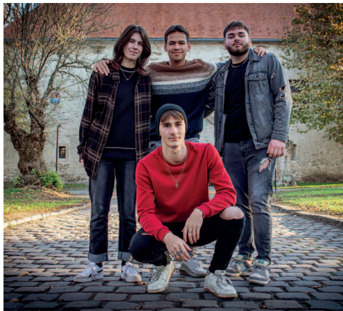
Jótékonyági koncertsorozatra indul a szerencsi Rosabelle zenekar