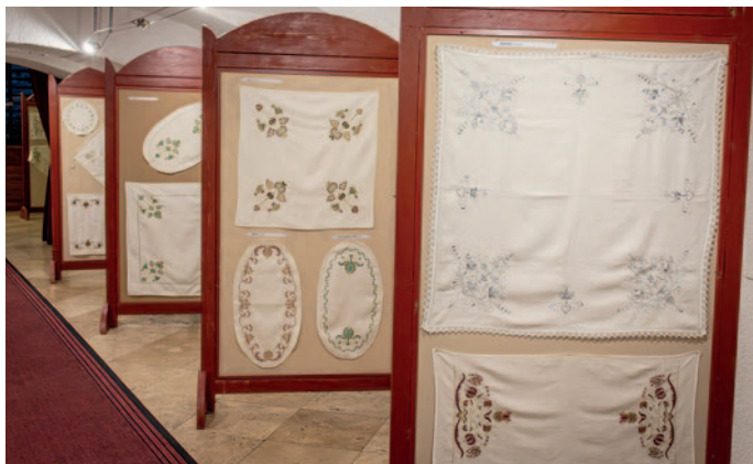
A kerek évforduló alkalmából ugyancsak 60 darab terítő került kiállításra