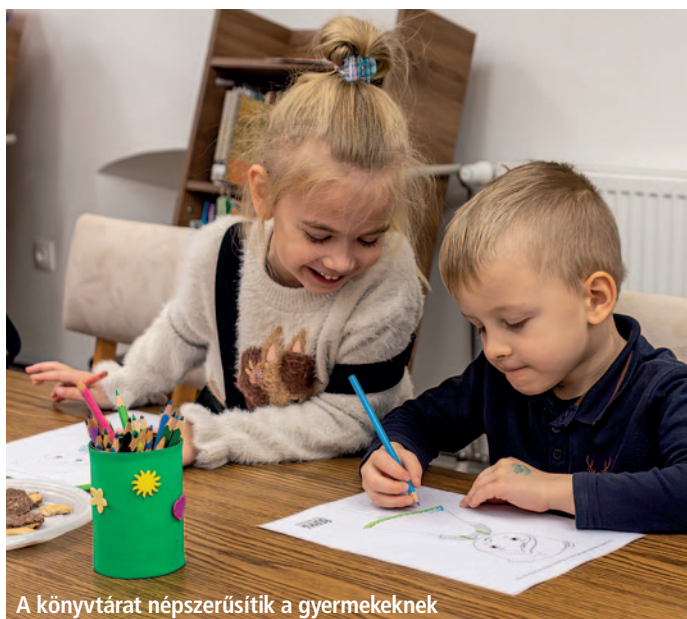
A könyvtárat népszerűsítik a gyermekeknek

A Szerencsi Városi Könyvtár idén először vett részt az Országos Rajzfilmünnep programjában, amely számos helyszínén hozza közelebb a klasszikus és kortárs rajzfilmek világát a gyermekekhez és családokhoz. Az esemény célja, hogy a mesék segítségével közösséget építsen, valamint a könyvtár szolgáltatásaira irányítsa a figyelmet.