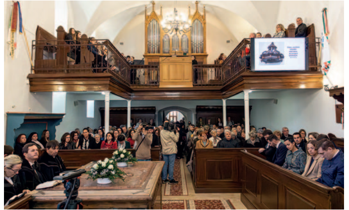
A kormány 200 millió forinttal támogatta a felújítást

Az ünnepi istentiszteleten teljesen megtelt a templom