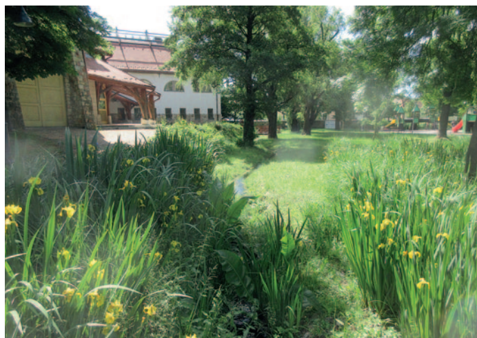
A várkert háttérben az iskolával 2021-ben

Már az 1980-as évek végén elkezdődött a Rákóczi út épületeinek felújítása, a homlokzatok régi karakterének visszaállítása, ami a mai napig is folytatódik. A városháza magastető kiegészítése és homlokzatának 'humanizálása' 2002-ben készült el, akkor vált a volt pártházból városházává. A volt Hunyadi iskola tornatermének tetőfedés cseréje és homlokzati vakolása 2014-ben valósult meg. A 2010-es évek második felétől a református templom és a kertjében lévő épületek és építmények is megújultak. Az utóbbi néhány évben is sok építkezés történt, talán a legjelentősebb a piac építése