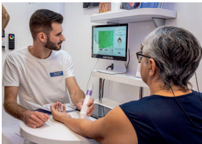
Bőrgyógyászati vizsgálat a szűrőkamionban

Magyarország átfogó egészségvédelmi szűrőprogramja (MÁESZ) november 9-én Szerencsen, a helyi Lidl parkolóban tartott a lakosság számára elérhető ingyenes szűrőnapot.