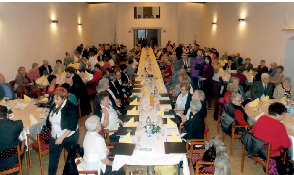
A 15 éves jubileumi ünnepség