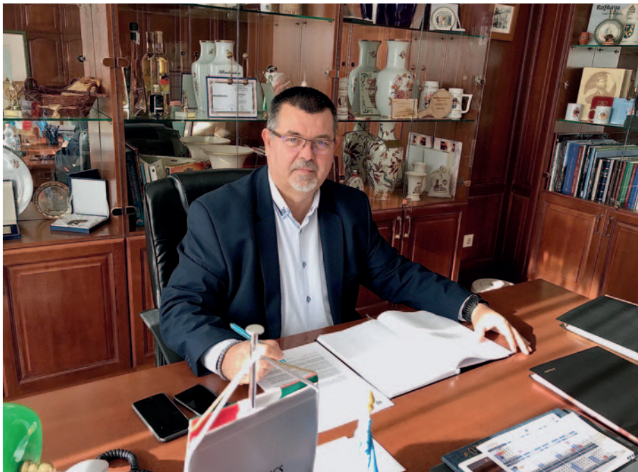
Nyiri Tibor polgármester

A város költségvetésében örökségül hagyott háromszáz millió forintos hiányt lefaragtuk és megteremtettük a pénzügyi egyensúlyt. Mára már nincs adósságunk. Az adóerő-képességünk a duplájára emelkedett, ami azt is jelenti, hogy többet kell befizetnünk a központi költségvetésbe és onnan kevesebbet kapunk. Az építkezések, a település fejlesztése mellett bővelkedtünk rangos évfordulókban, a járványt követően erősödtek közösségeink, bővelkedtünk rendezvényekben, eseményekben. Csupán kiragadott példaként említem a Gyár-kerti óvoda 50., a Nap-sugár óvoda 125. évfordulóját, a 100 éves a szerencsi csokoládégyártást, a 100 éves a Szerencsi Férfikart, a 30 éves Szerencs Város Sportegyesületét, a 40 éve újra város Szerencs. Jeles eseménynek tartom a Világörökségi Kapuzatnál évente megtartott „ünnepi fények eseményt”, aminek a 2023-as évben csúcseménye volt az igazi finn Mikulás látogatása, Joulupukki szerencsi látogatása. Hasonlóan büszke vagyok a Kossuth Rádió Országjáró adásnak helyszíni közvetítését, az ATV Hazahúzó két részes műsorát Szerencsről. Új közösségek is születtek, köztük a Nordic Walking csoport, a Szenior Örömtánc