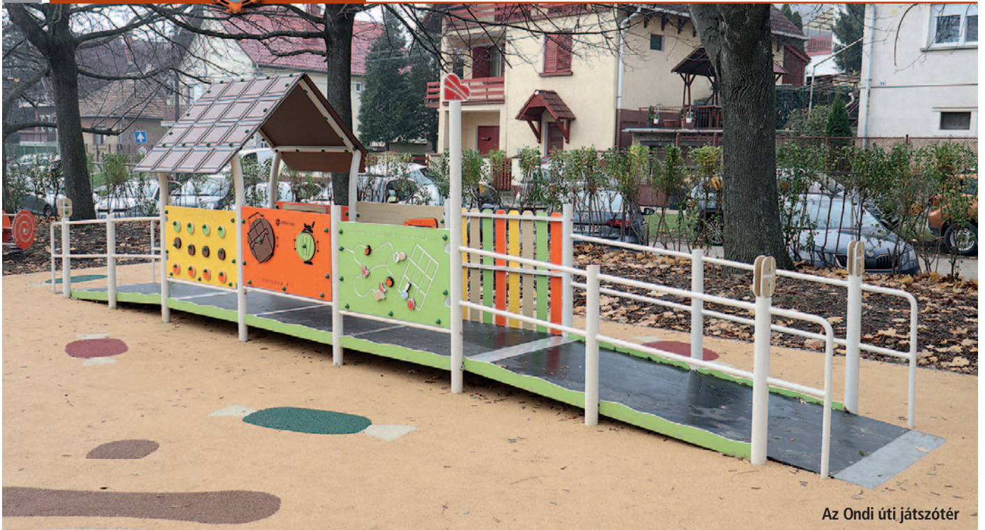
Az Ondi úti játszótér

területtől a bejáratig szilárd burkolatú bejáró és parkoló kialakítását, ivókút létesítését, a játszótér fenntartását és üzemeltetését. Bízom abban, hogy a „csokoládé játszótér” előnye messze túlmutatnak a közvetlen használaton, valamint hozzájárulnak egy befogadóbb és fejlettebb helyi társadalom kialakításához.