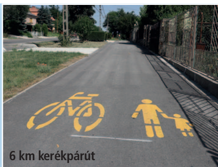
6 km kerékpárút

2024.08.30. XXXIX. évfolyam 8. szám INGYENES