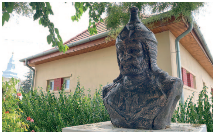
Ond vezér szobra ondi településrészen

„szerencséből” Szerencs, és innen kapták a nevüket a környező falvak is: Ond, Tállya, Rátka és Tarcal. Fontosnak tartom őseink hagyományát és tiszteletért ezért is vállalkoztam arra, hogy a Szerencsi Városgazda Non-profit Kft-vel közösen szobrot állítunk a település és a vezér tiszteletére.