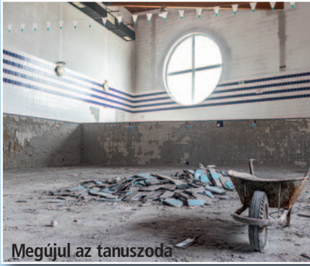
Megújul az tanuszoda