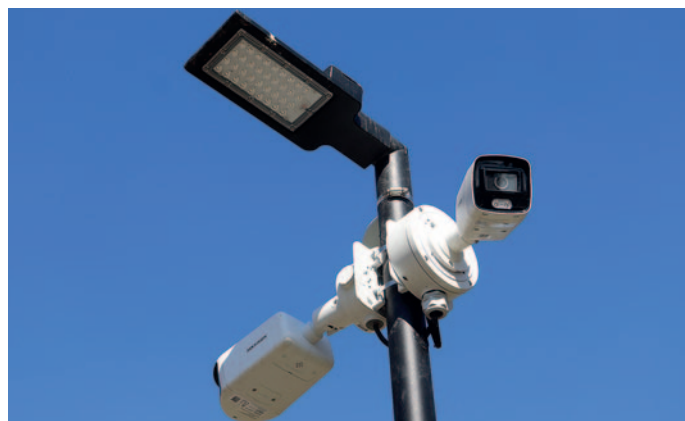
Közel 60 db kamera működik a városban

részt növeli a közbiztonságot és segíti a bűncselekmények megelőzését, felderítését. Másrészt javítja az állampolgárok biztonságérzetét és életminőségét.