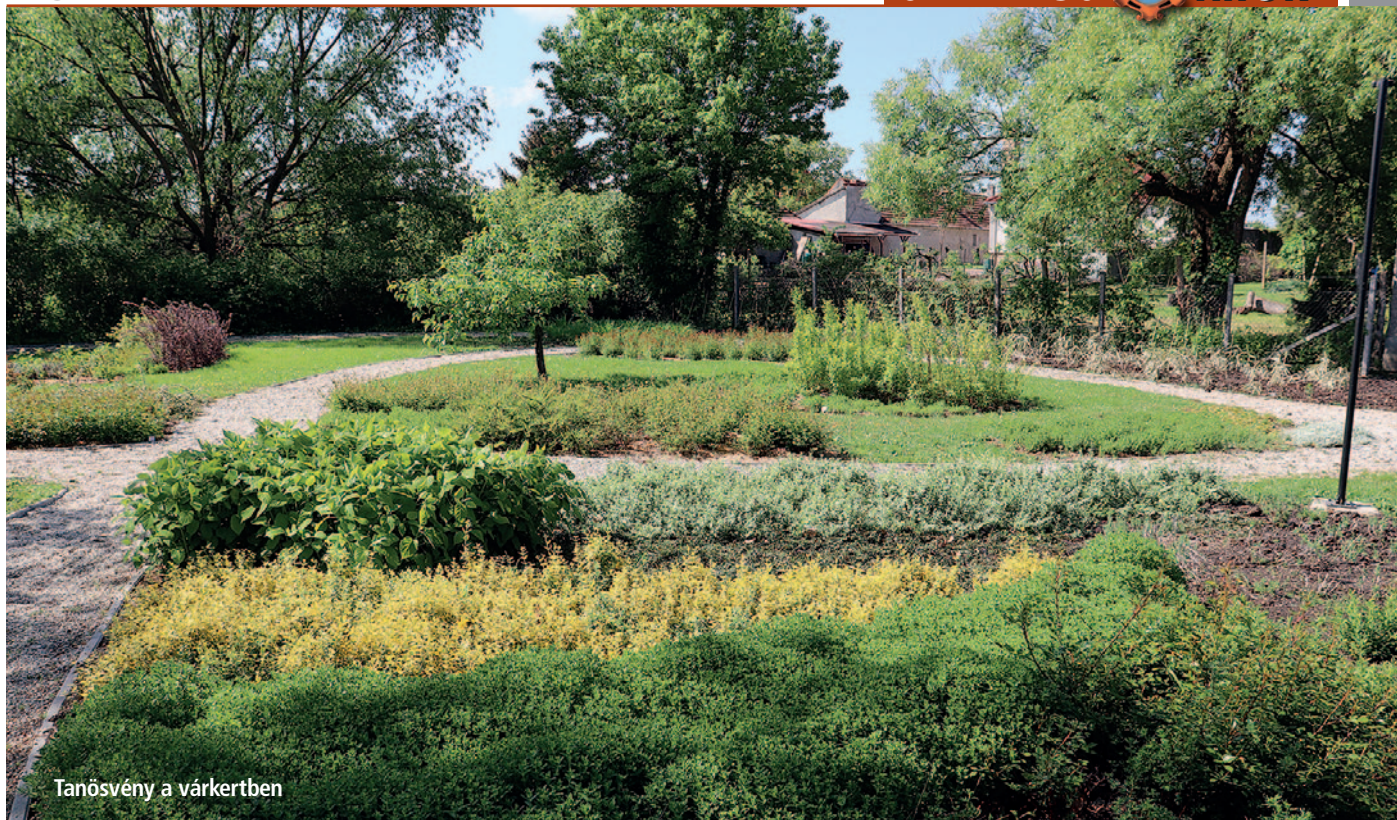
Tanösvény a várkertben

súlyos hibák keletkeztek. Nem visszafelé akarok mutogatni, de én egy kész helyzetet kaptam, ahol el kellett dönteni, hogy az ide járó gyerekek és emberek biztonságban vannak-e. Szakértői vélemény alapján döntött a képviselő-testület a tanuszoda bezárásáról és felújításáról. Ennek a projekt keretében kialakításra kerül a napelemes rendszer – a turisztikai központban már működik –, amely csökkenteni fogja az üzemeltetési költségeket. A munkaterületet végül május végén adtuk át a kivitelezőnek, amire az önkormányzat közel 250 millió forint vissza nem térítendő európai uniós támogatást nyert. Ha minden jól alakul akkor akár már az ősz folyamán újra kinyithat, minden attól függ, hogy a szükséges alkatrészek a világot más feléről időben ideérnek.