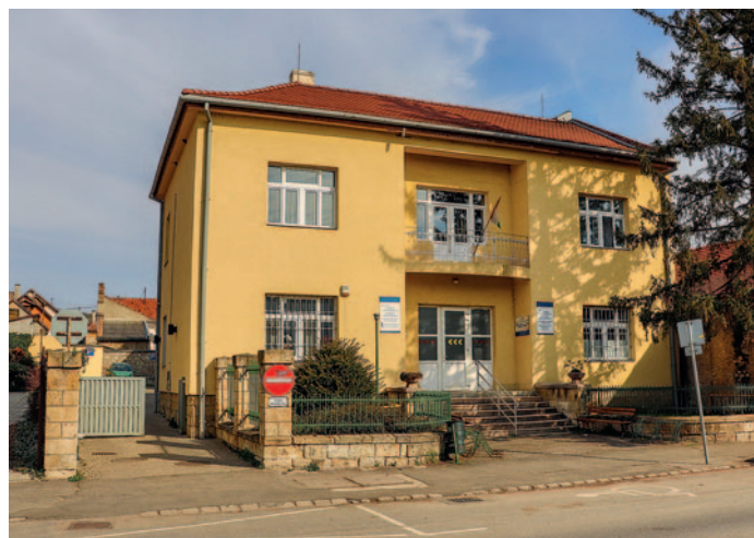
Szerencsen a megszokott helyen működik tovább az orvosi ügyelet

42. Az MVM csoport tavaly tavasszal felújította ügyfélszolgálati irodáját Szerencsen. Akkor elhangzott, hogy a vármegyében Miskolc mellett Szerencs a második település, ahol hét öt munkanapján hozzáértő szakemberektől kapnak választ kérdéseikre a fogyasztók.