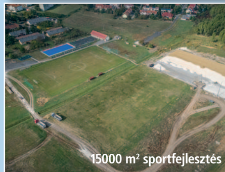
15000 m 2 sportfejlesztés