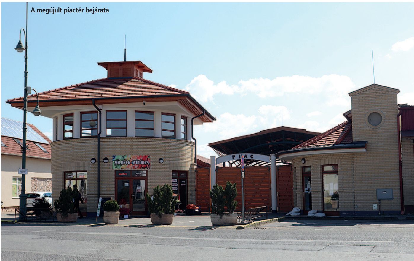
A megújult piactér bejárata

16. Megújult a piactér, amit ünnepélyes keretek között 2021 november 6-án a reggeli órákban adtunk át az eladóknak és vásárlóknak. Még 2017-ben egy sikeres pályázatnak köszönhetően indulhatott el a felújítási folyamat. Korábban a régi aszfalt alatt egy olyan csatornarendszer húzódtott, amely eredetileg nem szerepelt a felújítási tervekben. A kivitelezést ezért 2020-ban le kellett állítani, ám a munkálatok végül sikeresen folytatódtak. A vásártér nagyobb felülete új térkő borítást kapott, és a projekt előírásainak megfelelően 64 darab platán- és 12 db tölgyfát, valamint egyéb dísznövényeket ültettünk. A korábbiakhoz képest 34 darab új parkolót alakítottunk ki. A vásárcsarnokban összesen 14 darab üzlethelyiséget építettünk és egyéb szociális- valamint az üzemeltetéshez szükséges tárolókat létesítettünk. A vásártéren az árusok standjainak nagyságától függően nagyjából 60 kereskedőnek van hely. A piacon kibővítettük és felújítottuk a vizesblokkot, valamint korszerűsítettük a világítást is.