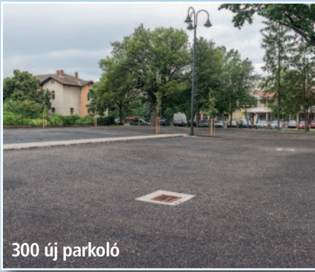
300 új parkoló