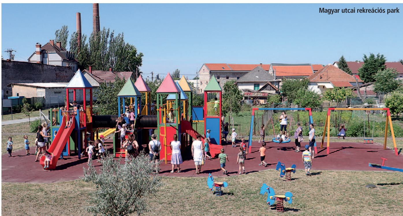
Magyar utcai rekreációs park

22. Ugyancsak játsszótér létesült a Rákóczi-vár kertjében, az Erzsébet téren és az Ondi úton. Ez utóbbi a helyiek körében csak „csokoládé játsszótérként ismert” és a mozgáskorlátozottak is igénybe vehetik. Az új játsszótér a Szerencsejáték Zrt. építette, de az önkormányzatnak is jelentős szerep jutott, hiszen vállalatuk a kerítés megépítését, a köz-