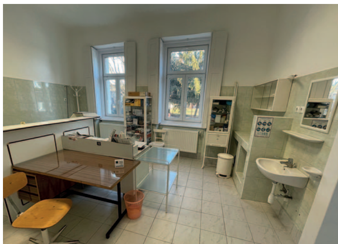
Megújult a Jókai utcai házi orvosi rendelő

44. Az átszervezett orvosi ügyelet Szerencs központtal működik tovább. Az új ügyeleti rendszer a mentőszolgálaton belül jön létre, külön egységekkel és járművekkel. A vármegyében több helyen is megszűnt, de Szerencsen továbbra is a megszokott helyen működik tovább az orvosi ügyelet. Szerencs Város Képviselő-testülete a 2023. március 9-ei rendkívüli ülésén határozott arról, hogy az Országos Mentőszolgálat megkeresésének eleget téve a tulajdonában lévő Rákóczi út 51. szám alatt erre a célra eddig is igénybe vett helyiségeket és a tulajdonában lévő ingóságokat térítés-mentesen átadja az orvosi ügyeleti feladatellátást biztosító szervezetnek.