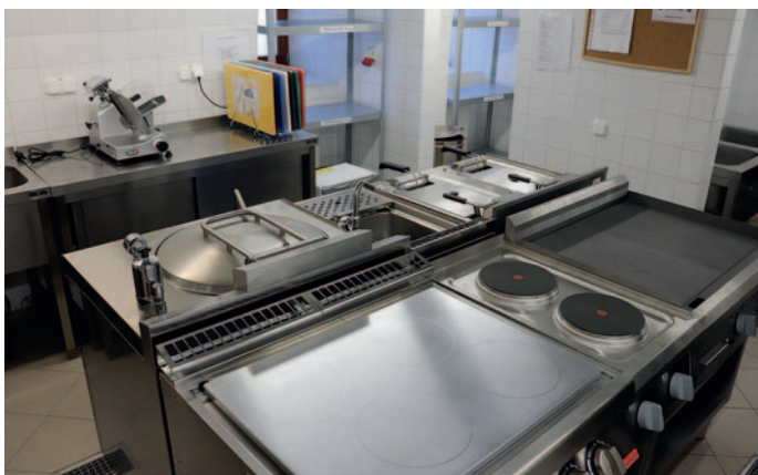
A Huszárvár Hotel felújított konyhája

30. Fejlesztettük az idős emberek ellátását biztosító támogató szolgálatot, a házi gondozást és korszerűsítettük a jelzőrendszeres segítségnyújtást. A házi segítségnyújtás olyan gondozási forma, mely az igénybe vevő önálló életvitelének fenntartását szolgálja megfelelően lakásán, lakókörnyezetében biztosítja, amelynek alapelve, hogy az idős ember a lehetőségekhez képest minél tovább maradjon meg saját