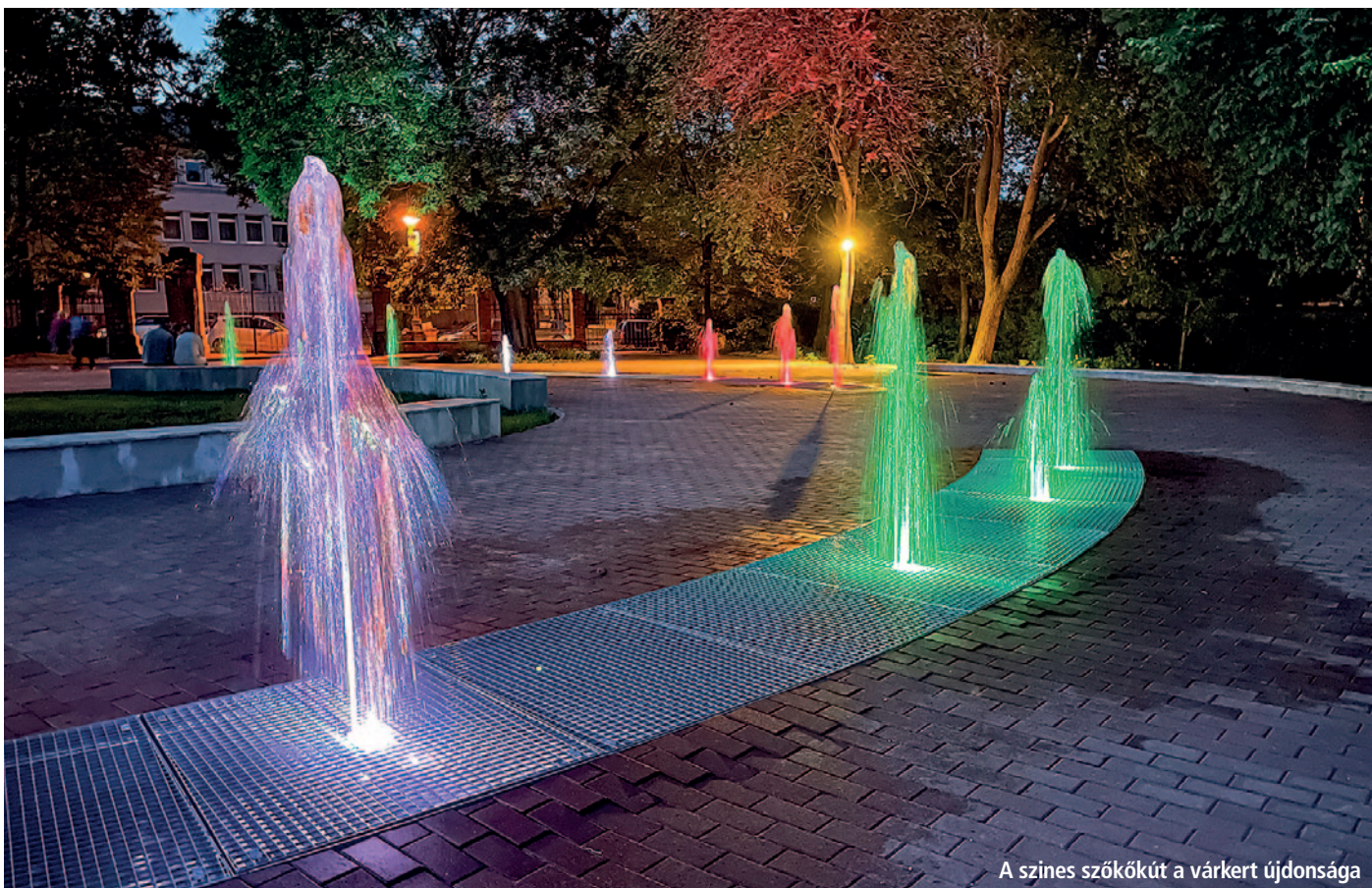
A színes szökőkút a várkert újdonsága

33. Megújult a Rákóczi-vár kertje. Mára időszerűvé vált a felújítása, hogy a 21. századi igényeknek is megfeleljen. A terület fontos turisztikai értéket képvisel, a növényzet gondozása továbbra is egy nagyon kiemelt feladat lesz. Természetesen ehhez a lakosság közreműködésére is szükség van, hiszen mindannyiunk érdeke, hogy ez az ékszerdoboz továbbra is megmaradjon. Az idelátogatóknak jogos igénye volt, hogy télen-nyáron tudják