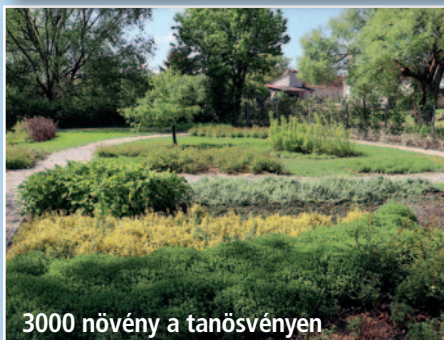
3000 növény a tanósvényen