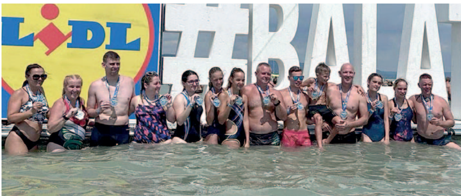
Az utóbbi években a szerencsiek mindig képviseltetik magukat a megmérettetésen

„A 7 órakor rajtoló első úszók közül közel 9500 amatőr és profi sportoló küzdötte le a délnyugati irányból megélelénkült szelet és hullámzást, hogy átúszhassák Közép-Európa legnagyobb távát. A balatonboglári strand árnyas zöldjében sokan pihentek meg a fárasztó úszás után” – közölték a szervezők. Hozzátették: mindeközben a 2,6 kilométeres távon 916 úszó indult el Balatonboglárról, majd egy félkört megtéve visszaérkeztek a kiindulási pontra. A nap programja a 8 órakor induló Balaton-áthúzással folytatódott, ahol 681 lelkes amatőrnek szurkolhattunk, akik SUP-deszkával abszolvták a Révfülöp és