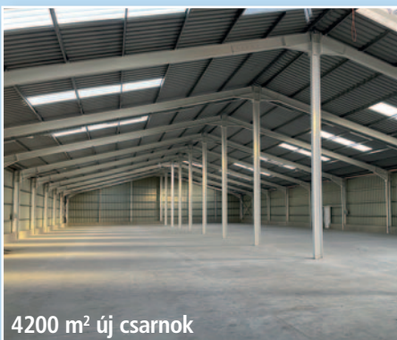
4200 m 2 új csarnok