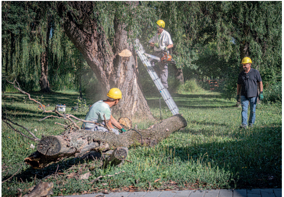
Ha nem muszáj egyetlen fát sem vágunk ki

A belvárosi kertészet dolgozói augusztus 1-én ismét szorgos munkába kezdtek, ezúttal a vár-