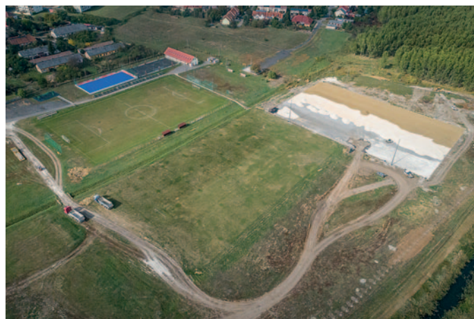
Új focipályák épültek

36. Szerencs Város Sportegyesülete kilenc szakosztályában közel háromszáz fiatal sportol és öt év alatt 425 millió forint TAO-támogatást sikerült elnyernünk és felhasználnunk. Ennek köszönhetően jelentős