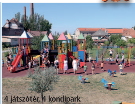
4 játszótér, 4 kondipark