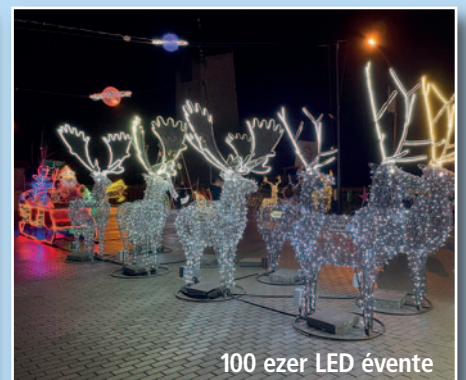
100 ezer LED évente