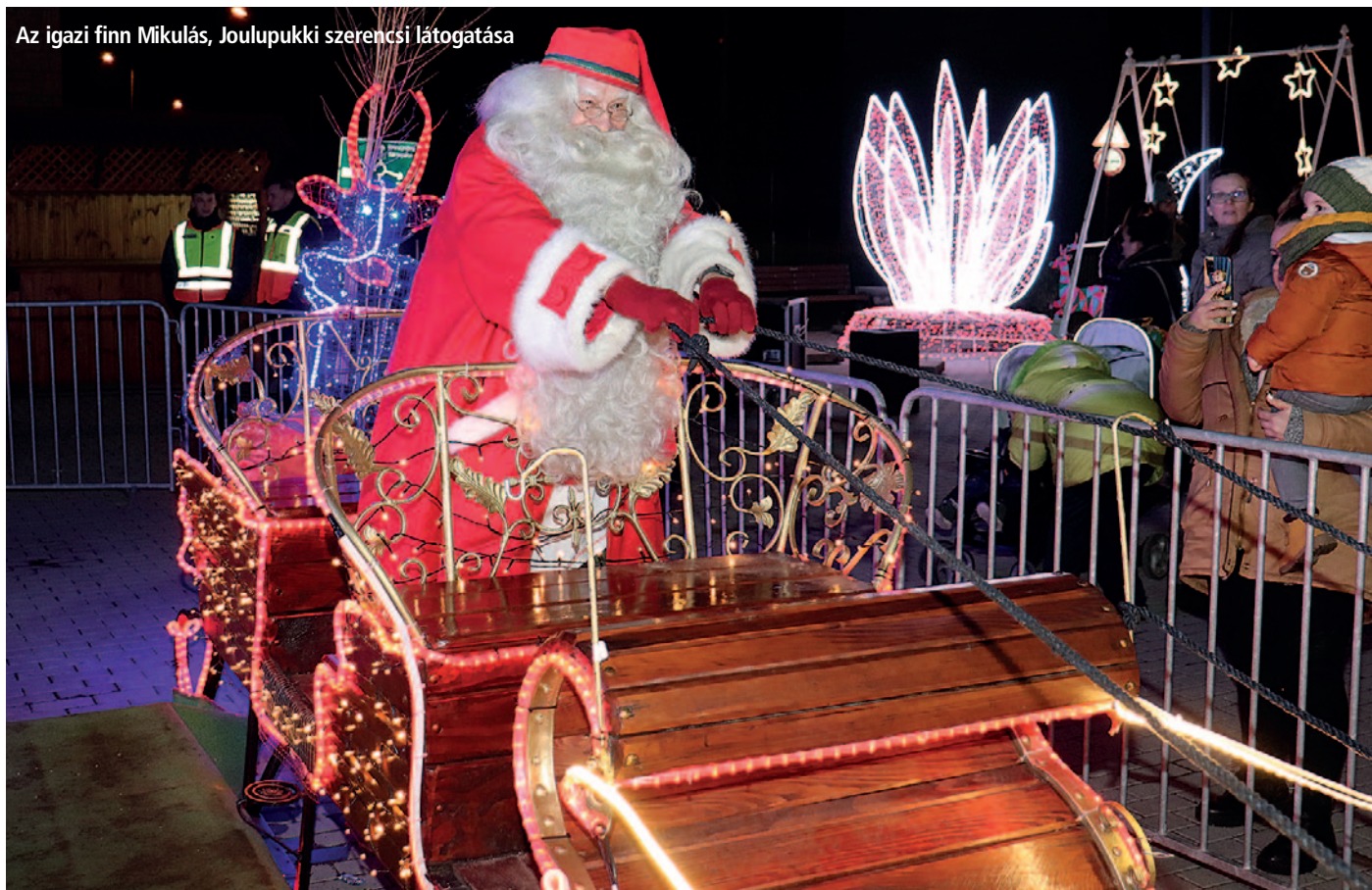
Az igazi finn Mikulás, Joulupukki szerencsi látogatása

40. Rendezvényteret építettünk a Világörökség Kapuzat mellett, ahol karácsonykor és húsvétkor kedveltek a fényinstallációk, Guinness-rekord született a Mikulás leghosszabb szánjából és ellátogatott ide az igazi finn Mikulás, Joulupukki. Az említett időpontokban egy igazán népszerű és kedvelt turisztikai attrakció született városunkban. Az ország különböző részeiről, de még külföldről is nem egyszer szervezett buszjáratok indultak Szerencsre, hogy megcsodálják a fényinstallációkat. Ezzel tovább öregbítettük a város jó hírnevét.