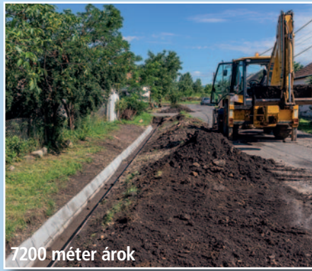
7200 méter árok