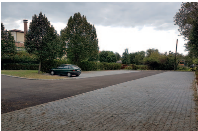
A Szerencsi Fürdő és Wellnessház melletti parkoló

6. Az elmúlt években több mint 300 parkolóhelyet építettünk Szerencsen. A belvárosban a Szerencsi Fürdő & Wellnessház mellett, a Béke utcában, a vasútállomáson, a Tatay Zoltán Ifjúsági Sporttelepen, a Tanuszoda előtt, a gimnázium hátsó bejáratánál, a piactéren és környékén, továbbá a Deák Ferenc, Magyar, Jókai Ferenc és az Alkotmány utcákban. A Szerencsi Polgármesteri Hivatal mellett a volt ÉMÁSZ-épület udvarán is megállóhelyeket alakítottunk ki. Bővültek a várakozóhelyek a Rákóczi úton is, annak felújítását követően.