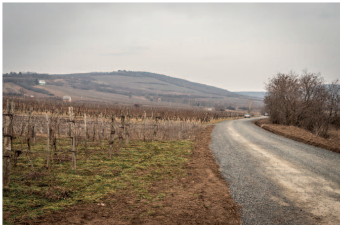
Az Aranka-tetőre vezető földút is megújult

sebb és tisztább fényt biztosítanak, ami jelentősen növeli a gyalogosok és az autók biztonságát az átkelőhelyeken. Emellett ezek a lámpák energia-takarékosabbak, így hozzájárulnak a fenntartható városi világításhoz.