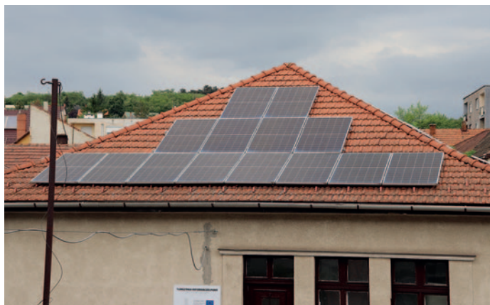
Napelem a szolgáltató ház tetején

34. Energetikai korszerűsítés történt az alábbi épületeken: Szerencsi Polgármesteri Hivatal, Hunyadi-iskola, Szerencsi Rákóczi Zsigmond Református Két Tanítási Nyelvű Általános Iskola Alapfokú Művészeti Iskola és Óvoda, Bocskai István Katolikus Gimnázium és Technikum, Tiszánineni Református Egyházkerület Szerencsi Idősek Otthona, Szerencsi Rendőrkapitányság, Szerencsi Katolikus Plébánia (volt úttörőház), Szerencsi Református Lelkesi Hivatal, amelyek külsőleg is megszépültek.