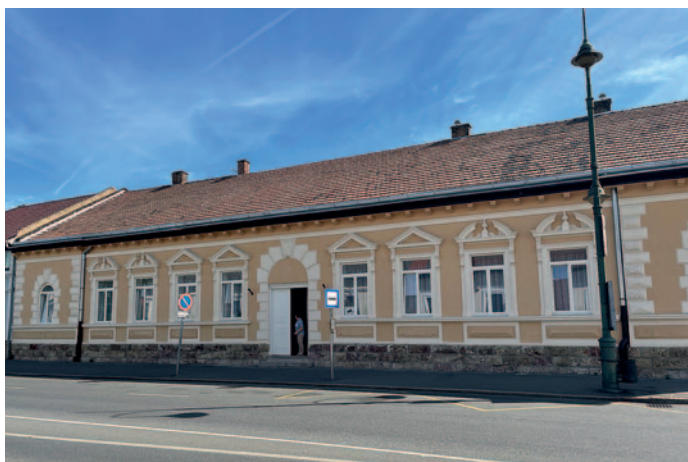
A megújult Közösségi Ház

17. Megtörtént az egykori „R-épület” külső és belső felújítása. A felújítás után ünnepélyes keretek között 2022 közepén átadtuk a Gyerekesély Program Szerencsi Kistérségnek a helyiek körében csak „R-épületként” ismert ingatlant. A modernizálásra azért volt szükség mert az építmény állapota az elmúlt évtizedek alatt jelentős mértékben romlott, ezáltal érdemi munkát ott már nem lehetett végezni. Az önkormányzat ezért úgy döntött, hogy egy pályázat keretében a Rákóczi út 99 szám alatti ingatlant felújítja, amire 100 millió forint állt a rendelkezésre. Ebből a pénzből kívül-belül felújították az épületet, korszerűsítették a fűtést, a régi ablakokat új nyílászárókra cseréltük, megvettük a szükséges irodai berendezéseket (számítógépek, íróasztalok, székek stb.) továbbá megtisztítottuk padlást és a régi cserepeket is. A pályázat lényege a gyermekszegénység visszaszorítása és az esélyegyenlőség megteremtése. A cél az, hogy a programba bevont tanulók általános iskolai eredményei javuljanak, a hiányzások és bukások száma csökkenjen, továbbá olyan ösztönző kényszer, tudás átadása, mellyel a munka világában megállják a helyüket.