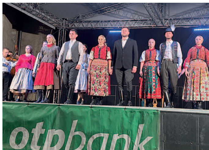
A Bekecs Néptáncegyüttes produkciója