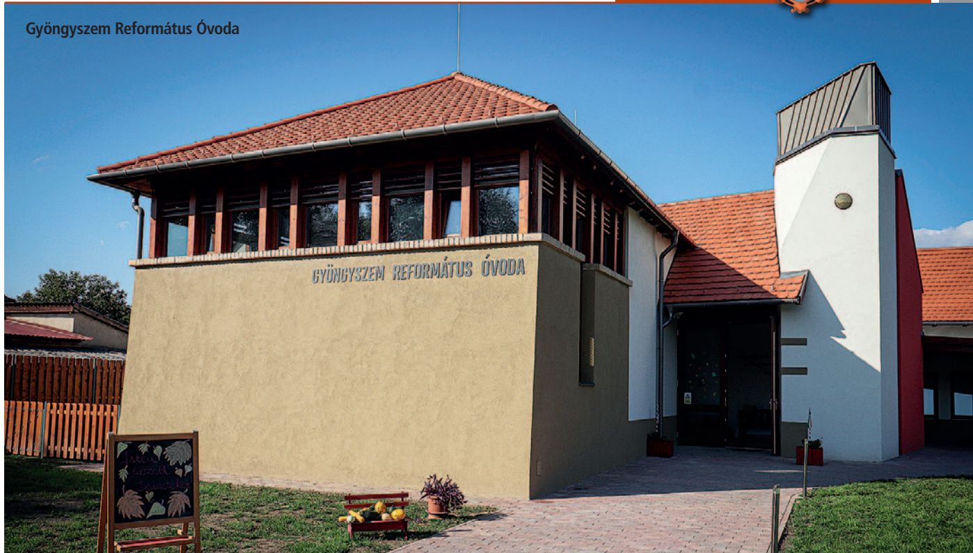
Gyöngyszem Református Óvoda

használni, ehhez pedig elengedhetetlen volt az utak részének a térkövezése. Ezen már az anyukák könnyedén tolhatják a babakocsikat. Megújultak a hidak is, hiszen a faszervezetük korábban már elkorhadtak. Új dizájnos formatervezett és helyi képivilággal ellátott hulladékgyűjtők, padok, székek és asztalok kerültek elhelyezésre, valamint a stég is megújult. Bátran állíthatom, hogy az új szökőkút már a szerencsi családok egyik kedvenc pihenőhelyévé vált, ahol szívesen töltenek el akár 2-3 órát is. Megújult a LED-es közvilágítás, amely a korábbi energiaszükséglet harmadával működik.