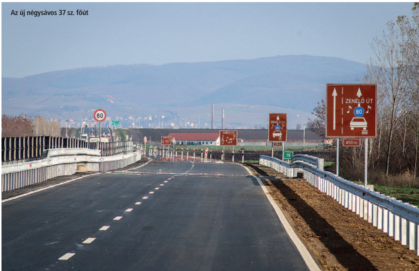
Az új négsávós 37 sz. főút

13. Tíz közterületen biztosítjuk az ingyenes internet hozzáférést. A munkálatok 2021-ben fejeződtek be. A WiFi4EU kezdeményezés célja, hogy szerte Európában ingyenes internet hozzáférést biztosítson a polgárok számára nyilvános helyeken, többek között parkokban, tereken, középületekben, könyvtárakban, egészségügyi központokban és múzeumokban. Úgy gondolom, hogy ma tizből, kilenc embernek szüksége és igénye is van a világháló igénybevételére. A hozzáférési pontok az alábbi helyszínen kerültek kialakításra: polgármesteri hivatal (körkörös sugárával), Geisenheim tér, rekreációs park (Magyar utca), vasútállomás, Tatay Zoltán Ifjúsági Sporttelep, Görcsös József Emlékpark, Rákóczi-vár tanösvény, várkert bástya játszótér, piactér, Zemplén kapuja (a 37-es számú főút mellett).