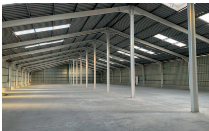
Az új könnyűszerkezetes cukorgyári csarnok

Megtörtént a kazánház felújítása, csarnoképítés, parkolók kialakítása, kamerák, sorompók felszerelése, optikai hálózat kiépítése és az irodaház állagmegóvása. Egyszóval minden a rendelkezésre áll ahhoz, hogy a vállalkozók igénybe vegyék a területet. Részben megújult a volt cukorgyári irodaház, a renoválás célja állagmegóvás volt. Jövőben az épületet jó eséllyel a szakképzés fogja használni.