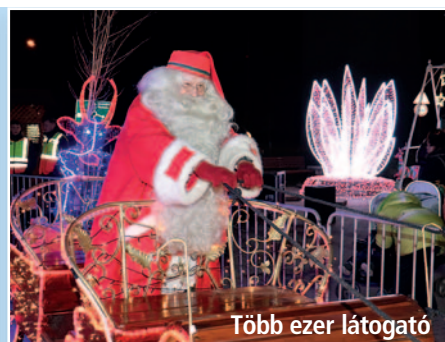
Több ezer látogató