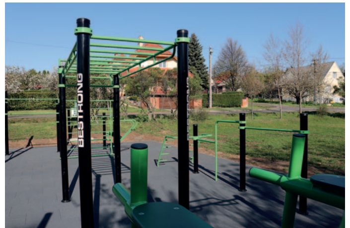
A Váci Mihály utcai kondipark

berek együtt mozoghatnak és támogathatják egymást az egészséges életmód fenntartásában.