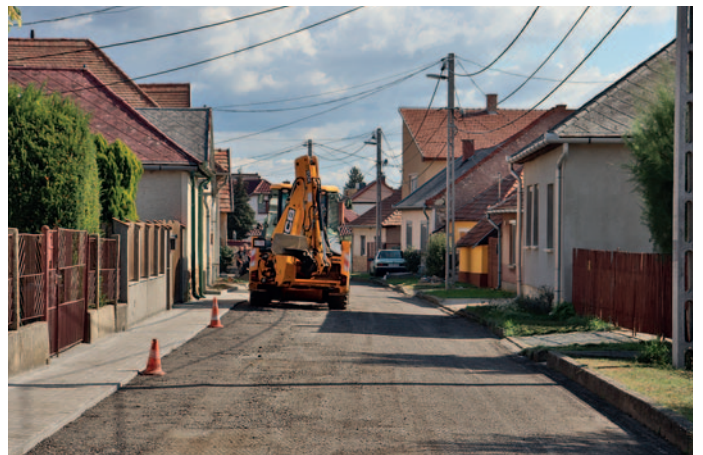
Széchenyi utca felújítása

8. Megújult a Széchenyi utca is. Azért esett erre a választás – azon kívül, hogy rossz állapotban volt – mert korábban ennek az útnak az óvoda előtti része már felújításra került. Fontos szempont volt még az is, hogy ha bármilyen okból lezárásra kerül a Rákóczi út, akkor a Széchenyi utca felújított útburkolata megfelelő terelőút lehet. Az állami pályázat eredetileg csak a Széchenyi köz és a Kórház köz közötti szakaszra terjed ki, azonban sikerült még egy támogatást szerezni, ennek köszönhetően az újjáépítés egészen a Késmárk utcáig folytatódott. Ezek mellett a Magyar utca teljes szakasza is felújításra került, a Kórház-közben pedig járdát építettünk.