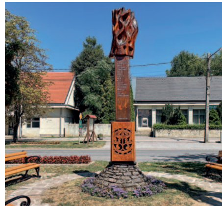
A felújított Zempléni Településszövetség szobora Tarcalon

A Zempléni Településszövetség, amely ma közel 70 tagtelepülést foglal magában, 1994-ben alakult és azóta is aktívan működik, összefogva a régió közösségeit. Az elmúlt harminc évben a szövetség sikeresen alkalmazkodott a folyamatosan változó politikai és önkormányzati környezethez, számos kihívást leküzdve és sok eredményt elérve.