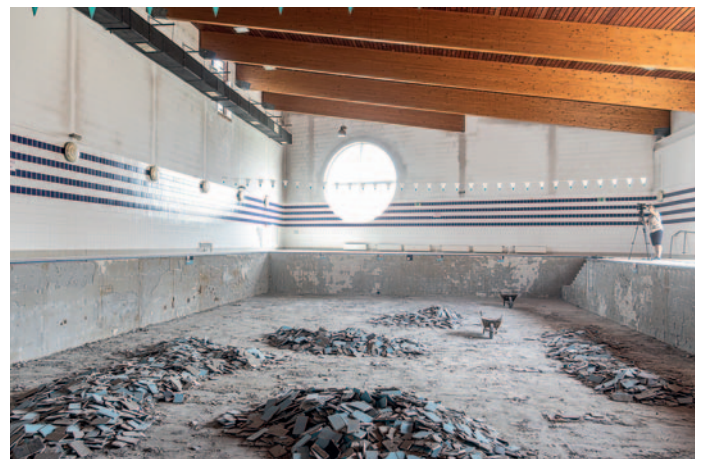
2024 májusában megkezdődött a tanuszoda felújítása

25. Megszüntettük a Városi Tanuszoda beázását és megtörtént a tető felújítása is. A mostani korszerűsítés elsősorban a medencét, a gépészet és villamoshálózatot érinti. Az épület 2005-ös átadását követően fokozott igénybevételnek volt kitéve, ennek megfelelően a gépházban is