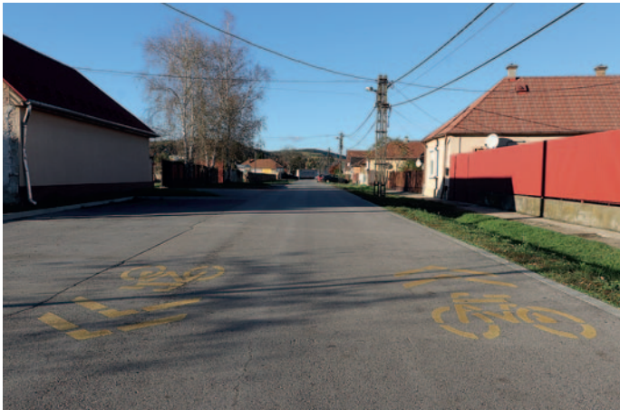
A Magyar utcai kerékpárút

5. A Malom és a Magyar utca burkolatát felújítottuk, a forgalmat egyirányúsítottuk és kerékpáros sávot festettünk fel a 3,5 méter széles, kétoldali padkával ellátott útpályára ezáltal a biciklisek biztonságosabban közlekedhetnek. A 37-es számú főút déli oldalán, Sátoraljaújhely irányában – a Szerencs-patak felett – elkészült az új kerékpáros híd, amin keresztül lehet eljutni az ipari parkig. Ezt a szakaszt meghosszabbítottuk egészen az IKR Agrár Kereskedelmi és Szolgáltató Kft. bekötőútjáig és a jövőben a BHD-től megvásárolt földterület után folytatódhat a Keleti-partelep bővítése, ami már kiajánlására került befektetési céllal.