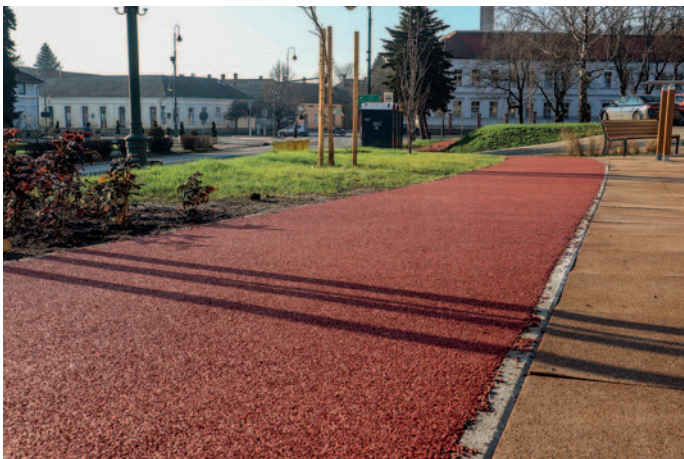
A belvárosban futókör épült

23. Pályázati támogatásból futókör létesült a belvárosban, ami a Rákóczi út, a Béke utca és az Ondi úttal határos területen épült. Ezen az akcióterületen három iskola is elhelyezkedik, a Bocskai István Katolikus Gimnázium és Technikum a Szerencsi SZC Műszaki és Szolgáltatási Technikum és Szakképző Iskola, valamint a Bolyai János Katolikus Általános Iskola. A környék az emeletes társasházak miatt sűrűn lakott, így az itt élők mellett a három intézmény diákjai is sokszor használják. A futókör mellett a járdák és kocsibeállók is megújultak.