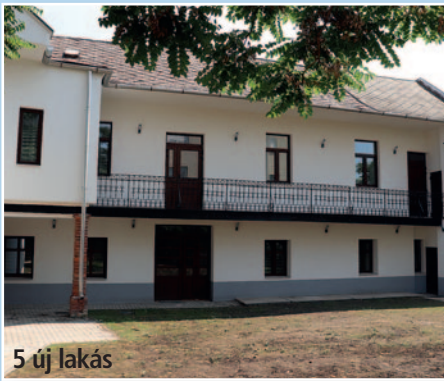
5 új lakás