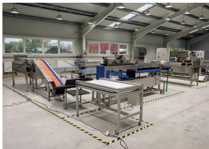
A Slopmax Kft. Gyümölcsfeldolgozó- és Aszalványüzeme

48. A Slopmax Kft. Gyümölcsfeldolgozó- és Aszalványüzemet, valamint a Bodrog-Kemi Kft. új telephelyet létesített a Keleti lpartelepen. A Vidékfejlesztési Program (VP) keretében, több mint 300 millió forintból megvalósult projekt a természet javainak vegyszermentes tartósításával az egészség védelmét szolgálja. Napjainkban egyre jobban felértékelődik a környezetbarát termelés, hiszen a világ változóban van. A „zero waste” technológia mellett az „upcycling” folyamat lényege, hogy az ipari, igen nagy energiaigényes folyamatokat elkerülve, a keletkező hulladékokból nagyobb értéket képviselő másik terméket állítanak elő.