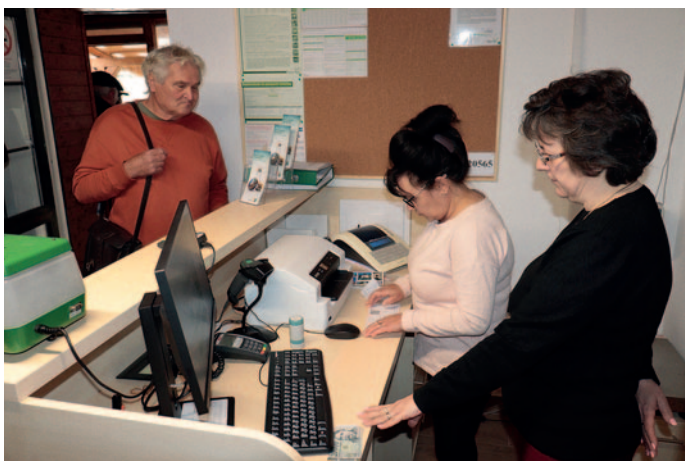
Az új ondi posta

14. PostaPontot létesítettünk Ondon. Az új szolgáltatás helyszíne Ondon a Monoki utca 8. szám alatt található Szatócsbolt lett, amely így a jövőben nemcsak kereskedelmi, hanem postai feladatokat is ellát. Magyar Posta Zrt. tavaly értesítette Szerencs Város Önkormányzatát arról, hogy az ondi postát bekapcsolják az Integrált Postai Hálózatba (IPH), ami lényegében a munkafolyamatok digitalizálását jelenti. Az IPH bevezetése számos előnnyel jár, hiszen a munkafolyamatok digitalizálásával gyorsabb és hatékonyabb ügyintézés valósulhat meg. Az ondi posta bekapcsolása ebbe a hálózatba nemcsak a helyi lakosok számára nyújt korszerűbb szolgáltatást, hanem az egész postai rendszer hatékonyságát is növeli. A digitalizált rendszer révén csökkennek az adminisztrációs terhek, és a postai dolgozók több időt tudnak fordítani az ügyfelek kiszolgálására.