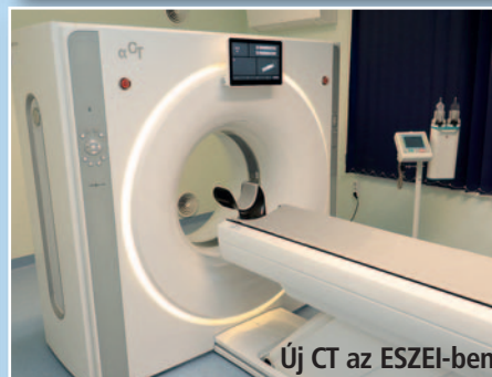
Új CT az ESZEI-ben