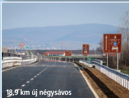
18,9 km új négysávós