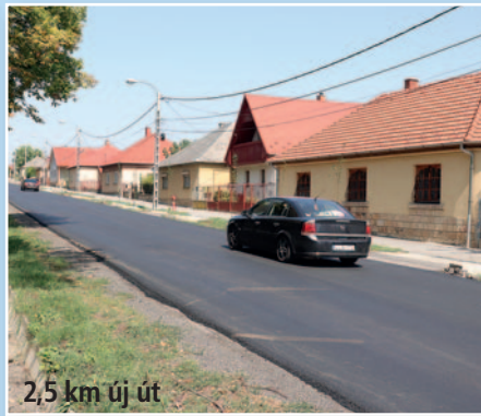
2,5 km új út