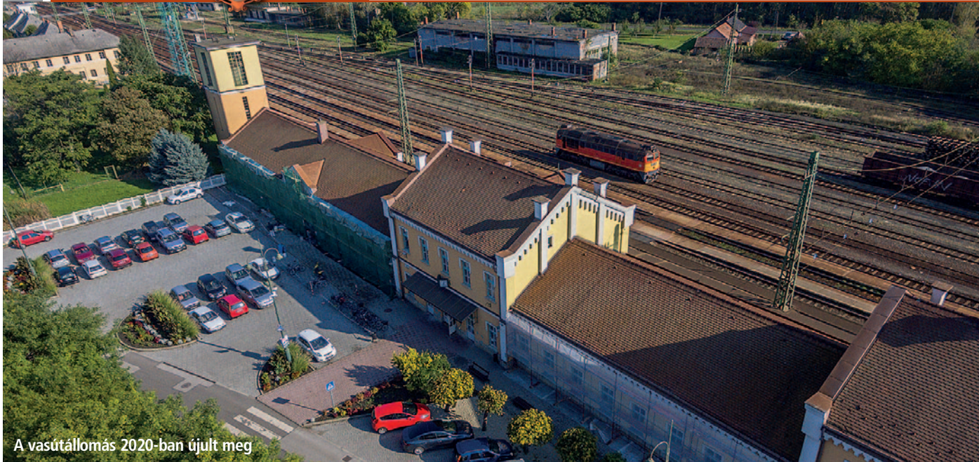
A vasútállomás 2020-ban újult meg

45. Az egészségügy korszerűsítése keretében megújult a Jókai utcai háziorvosi rendelő. A fejlesztésre 12 millió forintot nyert pályázaton az önkormányzat, amit 3 millió forintos önrésszel kellett kiegészíteni. Felújítják a homlokzatot és a teljes tetőszerkezetet, mert az elmúlt évek alatt az épület többször is beázott. Kicserélték a nyílászárókat és az ajtókat, újjáépítették a vizesblokkot, továbbá javították az épület falain keletkezett sérüléseket. Az önkormányzat megvásárolta az egészségügyi szolgáltatást nyújtó helyiségek mögötti ingatlanrészt, ahová az idősek otthonából a házi segítségnyújtás és a támogató szolgálat működik. Többek között volt tetőjavítás, belső terek vakolása, festés, szigetelése, irodák, mosdók, raktár kialakítása, amire önerőből 10 millió forintot fordítottunk.