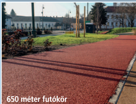
650 méter futókör