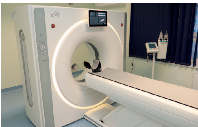
Korszerű CT-berendezéssel bővült a rendelőintézet

46. Gép- és műszerbeszerzések történtek a rendelőintézetben: ultrahang, műtőasztal, endoszkóp, röntgen, sterilizáló és CT. Utóbbi több éves várakozás után tavaly év végén végre átadhattuk a rendelőintézetnek. Nagyon kevés kisváros rendelkezik CT-berendezéssel, és az, hogy ilyen orvostechikai eszköz rendelkezésre áll helyben életeket menthet, mivel lerövidül a diagnózis felállításához szükséges várakozási idő. A berendezés az egyik legmodernebb a piacon, számos dologban felülmúlja az országban található többi gépet, így pontosabb diagnózis állítható fel.