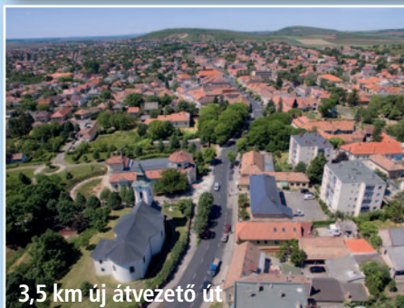
3,5 km új átvezető út