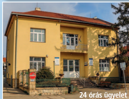
24 órás ügyelet