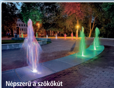
Népszerű a szökőkút