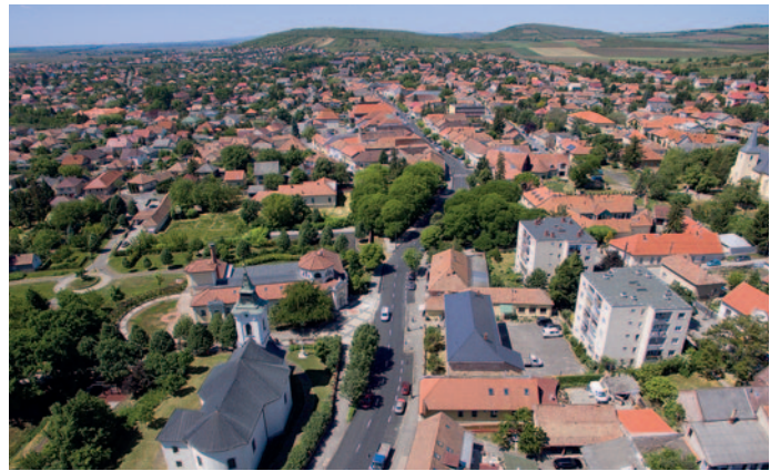
Évekkel korábban megújult a Rákóczi út alsó és felső szakasza

7. Felújításra került Szerencs főutcájának, a Rákóczi útnak a teljes szakasza, a Pozsonyi és Nagyvárad utcák Prügy irányába, az Ondi út és Ondon a Fő út. Az új útburkolat nemcsak esztétikusabbá, hanem biztonságosabbá és kényelmesebbé is teszi a közlekedést. A burkolat emellett csökkenti a járművek amortizációját is, mivel kevesebb úthibával kell megküzdeniük az autósoknak.