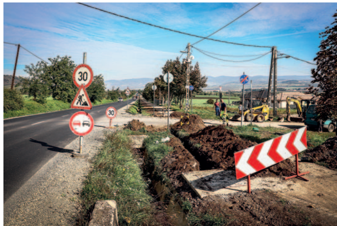
Az optikai hálózat kialakítása

39. A Rákóczi-várban turisztikai célú felújítások történtek. Hang-, fénytechnikát, színpadot vásároltunk, több mint 100 millió forintos pá-