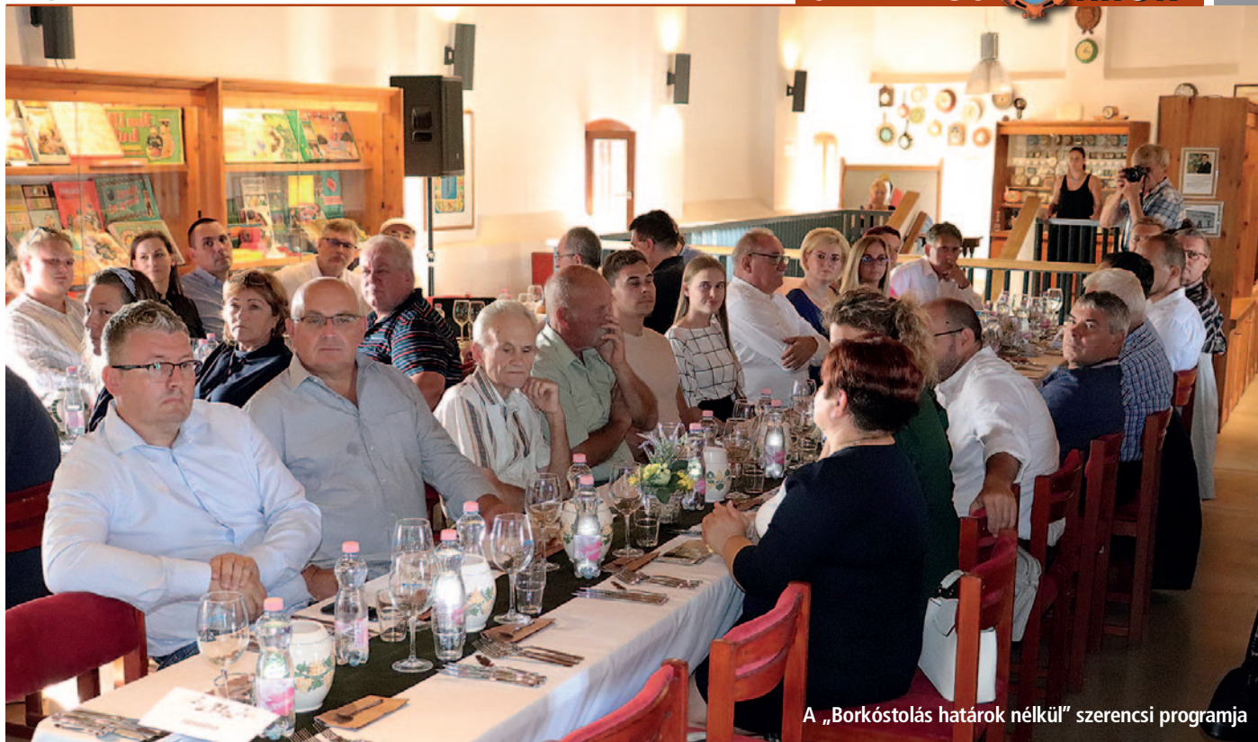
A „Borkóstolás határok nélkül” szerencsi programja

41. A szerencsi borászok kapcsolatépítését segítette a „Borkóstolás határok nélkül” programunk. Az Interreg Szlovákia-Magyarország Együttműködési Kezdeményezés keretében a Via Carpatia Európai Területi Programiroda támogatásával valósult meg, amelyen a kassai borászatok mellett Szerencs város 12 pincészete mutatkozott be. A projekt célja, hogy határon átnyúló, hosszútávú együttműködést kezdeményezzen Szerencs és Kassa városok helyi és szomszédos borászatai között. A szerencsi partner által, a projekt keretén belül elkészített imázsfilm a határon túli piacok érdeklődésének felkeltését, valamint a potenciális érdeklődők eljutásának segítségét célozzák, amely a termékek és szolgáltatások szélesebb körben való megismerését eredményezi. A projektben részt vevő szerencsi pincészetek a következők voltak: Árpád-hegy Pince Bt., Barra Pincészet Kft., Béres Pincészet, Budányi János Pincészete, Bukovszky Pincészet, Ducsay János Pincészete, Montium Bor Kft., Rozsnyai család Pincészete, Szabó Pince, Tokaj IM, Tallár Pincészet és Vino Bt.