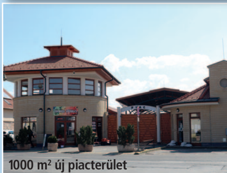
1000 m 2 új piacterület