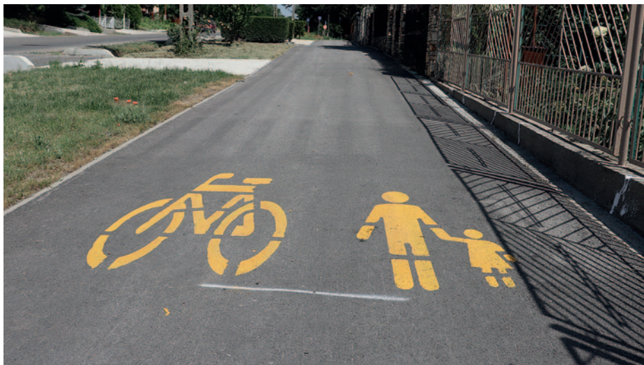
Az új Ondi úti kerékpárút

3. A „Szerencs központú agglomeráció szennyvízelvezetése és tisztítása” elnevezésű projekt keretében Szerencsen a Malomtanján és a Vári-telepen még az idén májusban kiépül a szennyvízcsatorna-hálózat. A meglévő hálózatokon vezetékrekonstruktions munkálatokat végeznek, a Rákóczi út teljes szakaszán megtörtént a vezeték útfelbontás nélküli bélelése, a szerencsi szennyvíztisztító-telepen