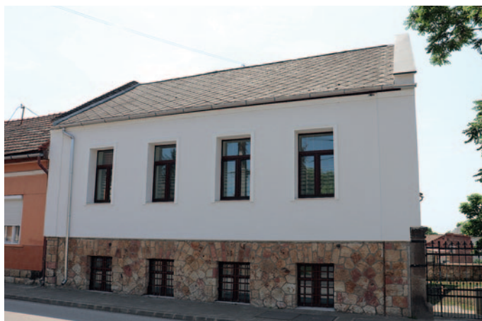
A Kossuth Lajos utcai önkormányzati lakóház

28. Az egykori cukorgyár területén infrastruktúrát építettünk, hat darab 1,5-2 hektáros befektetésre alkalmas terület alakítottunk ki.