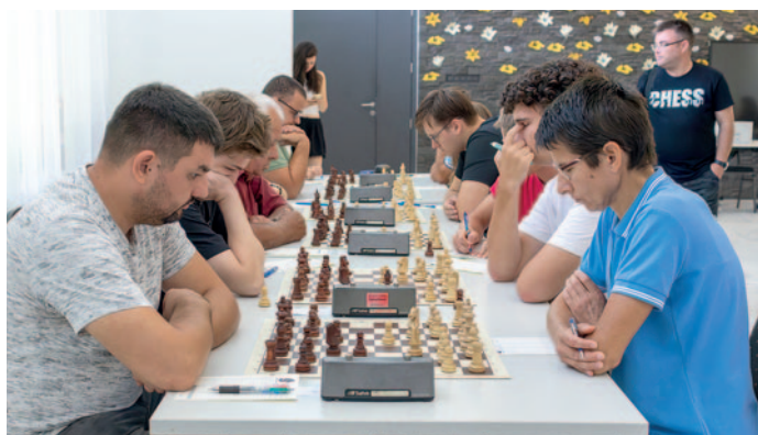
A mérkőzéseket a Szerencsi Középiskolai Kollégiumban tartották

Harmincnegyedik alkalommal rendezték meg városunkban augusztus 17-20-a között a Zemplén Kupa Sakkversenyt. Az eseményre az ország minden részéről érkeztek játékosok.