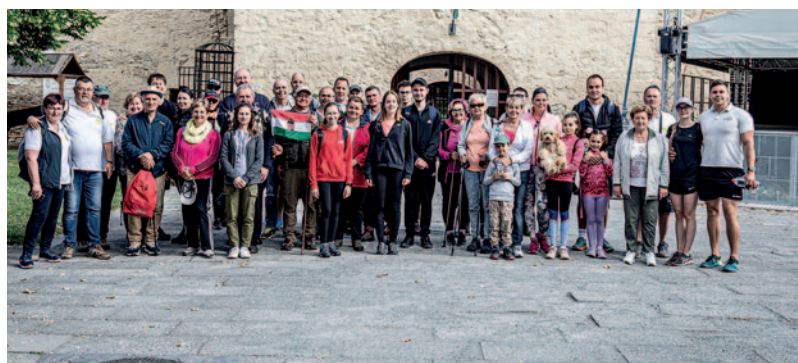
A résztvevők minden évben kb. húsz kilométert gyalognak.

minden évben május 10-e környékén tartanak. A hagyomány célja, hogy felhívja a társadalom, különösen az ifjúság figyelmét az őket körülvevő élővilágra és a természetvédelem fontosságára. A túra során a városvezető több alkalommal is rövid előadást tartott Szerencsi-dombvidék növény- és állatvilágáról.