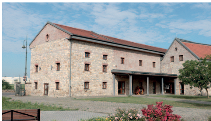
Napelem kerül a Turisztikai Központra.

Komplett hibrid napelemes (fotovoltaikus) rendszer telepítése, villamos hálózatra és akkumulátor szekrényre kapcsolása, mono/poli kristályos vagy vékonyrétegű napelemekkel és szigetüzemű működésre alkalmas akkumulátorral szerelve, magas tetőre telepítve, lekötő elemekkel, kompletten, 10,0 kWp napelem és 10,0 kW akkumulátor. Szerencs Város Önkormányzata 2024. május 27-én átadta a munkaterületet a nyertes vállalkozók részére, akik június első hetében mindkét épület esetében megkezdik a kivitelezést. Az önkormányzat a felújítás állapotáról folyamatosan tájékoztatni fogja a lakosságot.