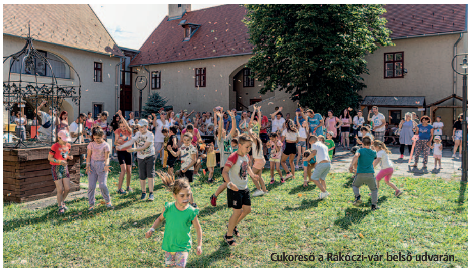
Cukoreső a Rákóczi-vár belső udvarán.

A Szerencsi Művelődési Központ és Könyvtár május 26-án igazi családi hangulatot varázsolt a Rákóczi-várba, hiszen Gyermeknap alkalmából számos izgalmas programmal készültek a legkisebbek és családjaik számára.