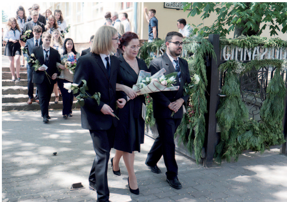
A ballagók egy utolsó közös sétával búcsúztak a gimnáziumtól.

Idén négy osztály intett búcsút a középiskolás éveknél a Bocskai István Katolikus Gimnázium és Technikumban. A május 4-én megtartott ballagáson a diákok a hagyományok szerint, vállukra vetett tarisznyával, kezükben virágcsokrokkal járták végig az iskola folyosóit az alsóbb évesek sorfala között.