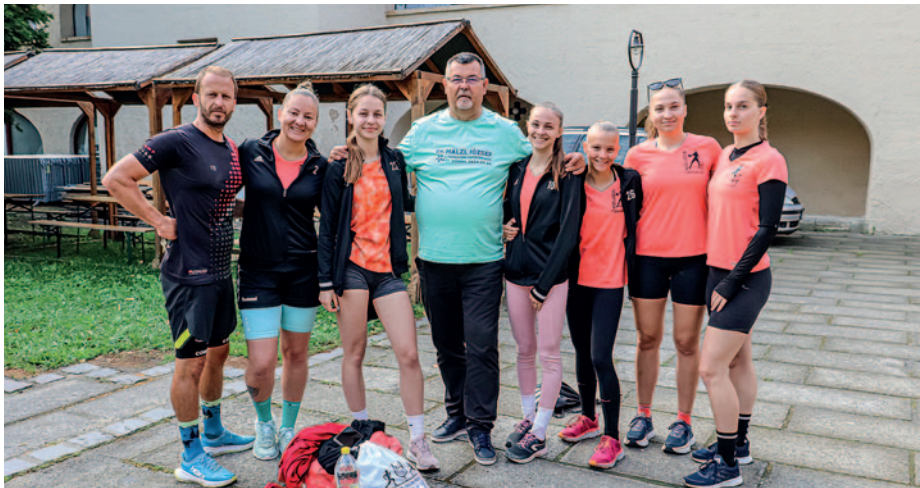
Rajtra készen a szerencsi csapat.

Az verseny útvonala: Rákóczi-vár, Bekecs, Takaharkány, Tiszalúc, Kesznyéten, Kiscséc, Girincs, Köröm, Muhi majd onnan az Ónodi vásártér végül pedig az Ónodi vár. A futók már korán reggel a szerencsi Rákóczi-várban gyülekeztek, hogy végül leküzdjék a 42,5 kilométeres távot. Városunkból a legnagyobb létszámmal az SZVSE női kézilabdásai indultak, akik kicsivel több mint 3 óra 30 perc alatt futották le egymást felváltva a távot. A csapatok emléklapok, kupát és pólót kaptak ajándékba, az egyéni futók közül az első hat helyezett pénzdíjazásban is részesült.