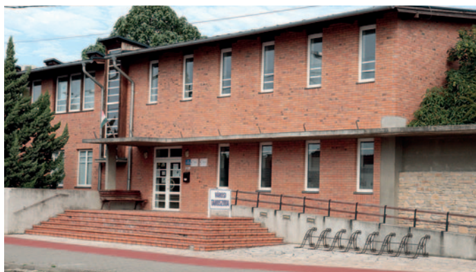
A kivitelező hamarosan megkezdte a felújítást a Városi Tanuszodában.

Légtechnikai rendszer: A projekt kapcsán a meglévő korszerűtlen és működésre alkalmatlan szellőzői rendszer újra tervezése valósul meg a nagy- és kis medence területet ellátó rendszer tekintetében egyaránt. A régi légtechnikai rendszer teljes mértékben bontásra kerül, helyére új légkezelő és légcsatorna hálózat kiépítése tervezett. Az új rendszer a páratartalom szabályozásra is alkalmas. A tervezett légkezelő egy hővisszanyerő egységgel és egy integrált hőszivattyús egységgel rendelkezik. Vegyszer-elszívó rendszer korszerűsítése. Öltözők szellőző rendszerének felújítása. Egyéb gépészeti felújítások: Meglévő szolár rendszer felújítása, új szolár