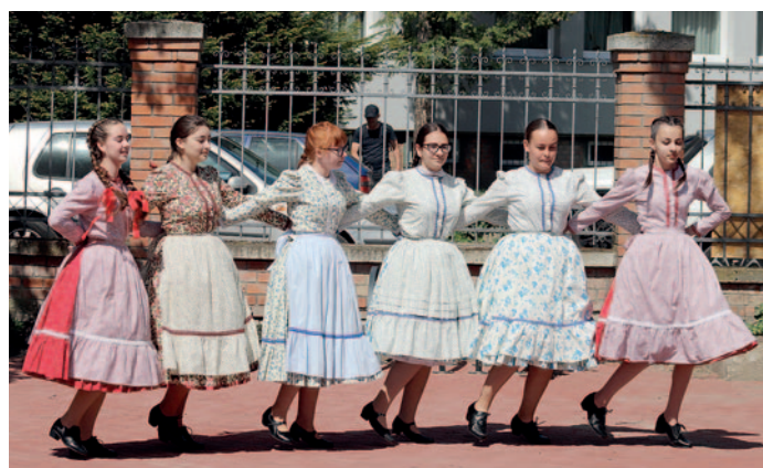
A Hajnali Néptáncgyűttes.