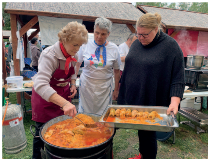
A finom ételeket hamar elkapkodták a vendégek.

A XXX. Nemzetközi Nemzetiségi és Töltött Káposzta Fesztivált május 18-án rendezték meg Rátkán.