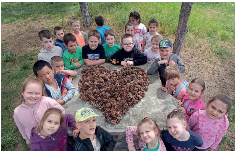
A tiszta környezetért tettek a bolyais diákok

Fenntarthatósági Témahetet tartottak május első hetében a Bolyai János Katolikus Általános Iskolában – olvasható az intézmény közösségi oldalán.