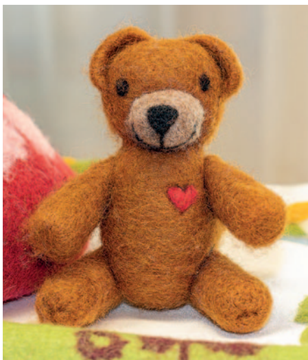
A foglalkozásokon főként állatfigurákat készítettek.

A Szerencsi Óvoda és Bölcsőde öt pedagógusa a nemezelés ősi technikájával ismerkedett meg a közelmúltban, a SZAKKÖR elnevezésű program keretében, melyet a Nemzeti Művelődési Intézet támogatott.