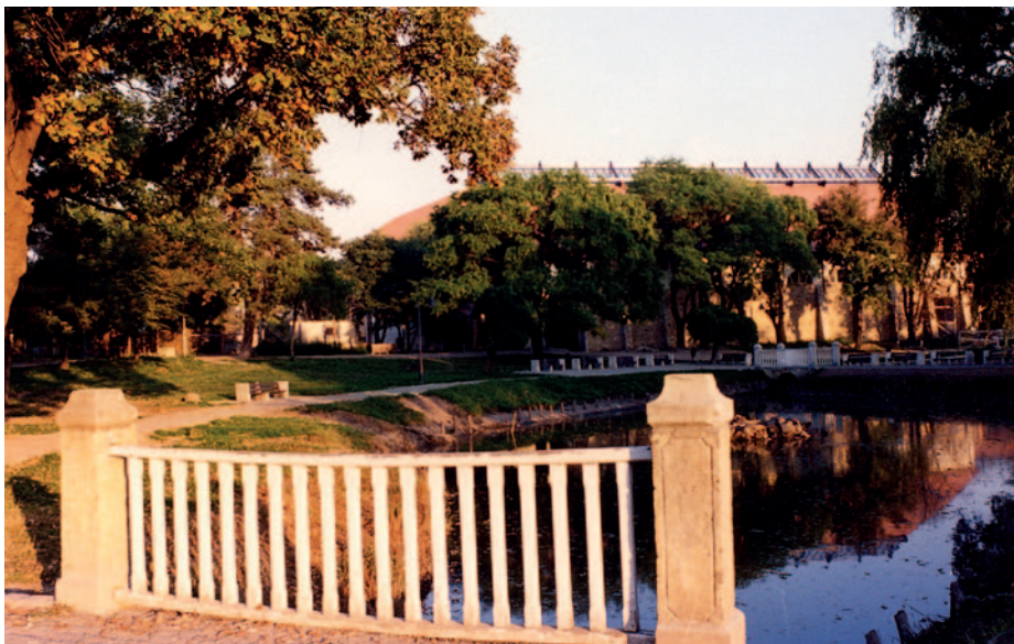
A várkert látványa 1990-ben.

Sokoldalú építész volt. Több középkori eredetű magyarországi vár helyreállítása, vagy várrom restaurálása készült el a tervei szerint: a Szerencsi vár, a Kispánai, a Várgesztesi és a Szigetvári vár. 1967-ben Ybl-díjat kapott „a műemléki épületek helyreállításának tervezési munkájáért”. A Szerencsi Vár több évtizedig tartó felújításához az épület oldalánál a teljes nyugati várkert részt elfoglalták a műhelyek, ahol a lakatos, asztalos, kőfaragó, műköves és egyéb munkákat készítették. A műhelyek és az irodák fa barakkokban helyezkedtek el egy körülkerített területen, mint valami munkatáborban, több évtizeden keresztül. Itt készültek a vár felújításának részfeladatai, és a régió műemléki felújításaihoz szükséges szakipari munkák is. Ha egyszer már berendezkedtek, évtizedekig nem mentek el, gyárterülettelé alakítva a várkert egy részét. A terület az 1991-es átadás után szabadult fel, egy