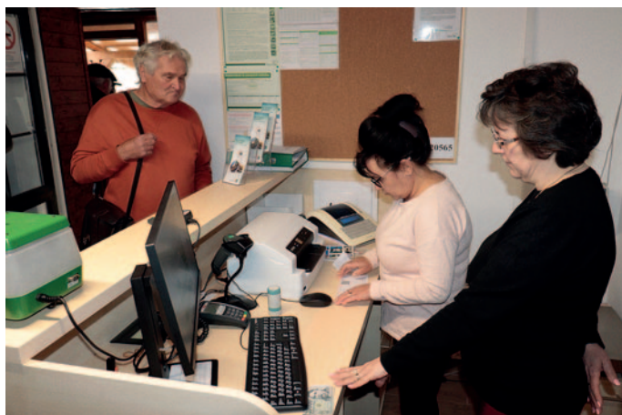
Az új helyszínen a lakosok minden megszokott postai szolgáltatást igénybe vehetnek.