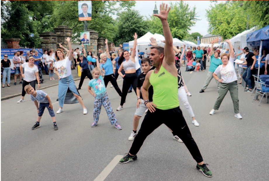
Katus Attila világ- és Európa-bajnok sportoló alaposan megmozgatta a helyszínre érkezőket.