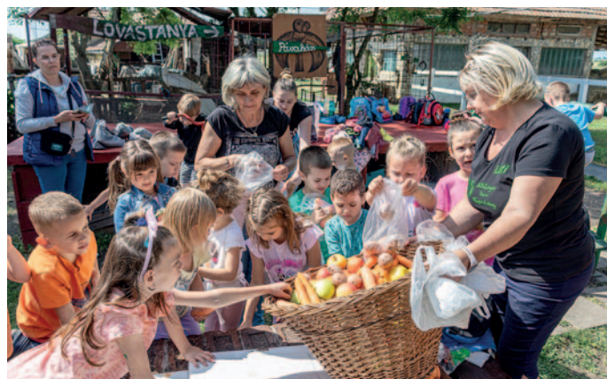
Az óvodások ételt vittek az állatoknak.

A Napsugár épületben május 22-én a vesszőfonás ősi technikájával ismerkedtek meg a gyerekek. Az esemény célja az volt, hogy a kicsik megtapasztalják ezt a hagyományos kézműves tevékenységet, amely rövidtávon nemcsak szórakoztató, hanem számos fejlesztő hatással is bír. Pozitívan hat a kézügyesség és a finommotoros készségek fejlesztésében, javul a kézügyesség is. Ez a tevékenység különösen fontos a korai életszakaszban, amikor a gyerekek motorikus készségei gyorsan fejlődnek. A vesszőfonás megismertetése a gyerekekkel egyúttal a hagyományörzés fontosságára is felhívja a figyelmet. Az ilyen tevékenységek révén a kicsik megtanulják értékelni a régi mesterségeket, megismerkednek kulturális örökségünkkel, és kialakul bennük a hagyományok iránti tisztelet.