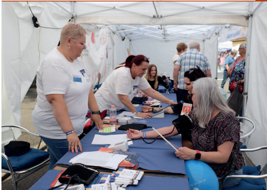
Sok szűrővizsgálat volt elérhető.