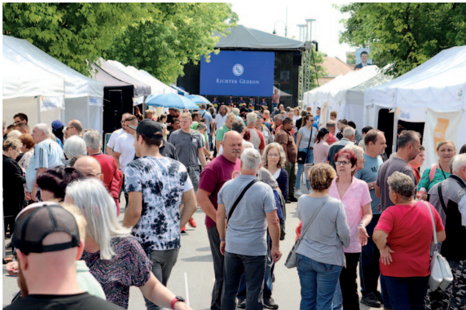
Richter Egészségváros a Rákóczi úton.

A Richter Egészségváros egyik hagyományos programja a Richter Gedeon életét bemutató, Nem tűntem el című film levetítése. A film 2014-ben készült Richter Gedeon halálának 70. évfordulójára. Különlegessége abban rejlik, hogy egy klasszikus dokumentumfilm helyett neves magyar színészek kalauzolnak el minket a XX. századi Magyarországra, korhű jelmezekkel és környezettel bemutatva Richter Gedeon életét, és az ő máig meghatározó hagyatékát. A film főszerepében Rudolf Péter, Jászai Mari-díjas színész, a Vígszínház igazgatója látható, aki egyben a Richter Egészségváros fővédnöke is. „Richter Gedeon 1872-ben született a Heves megyei Ecséden. Árvaként testvéreivel együtt a nagyszülei nevelték fel Gyöngyösön. Alig 30 év múlva megalapította Magyarország első modern gyógyszeripari vállalatát, és nevét néhány évvel később már a világ közel száz országában ismerték. A többi már történelem. Filmünk egy különös férfi alakját festi fel, aki eredeti gon-