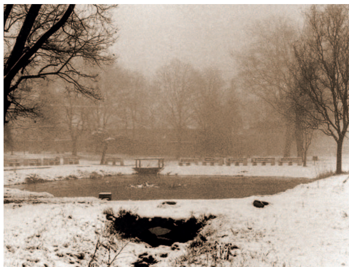
Télies kép 1988-ban.