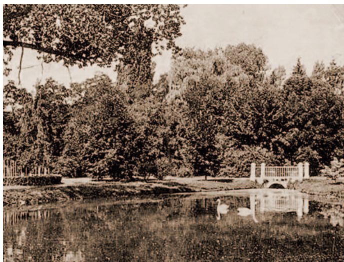
A várkerti tó kb. 1910-es évek elején.