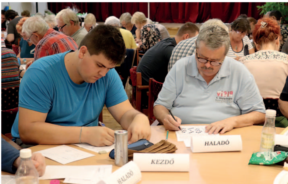
Az ország minden részéről érkeztek versenyzők.