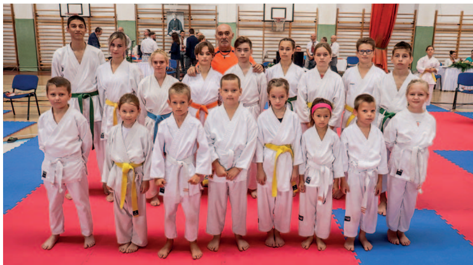
A szerencsi gárda résztvevői.

Szerencsen az idén kilencedik alkalommal rendezték meg szeptember 23-án az SKS Ippon Shobu Országos Felkészítő Bajnokságot.