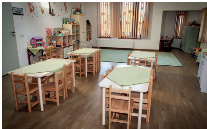
Modern belső várja a kicsiket.