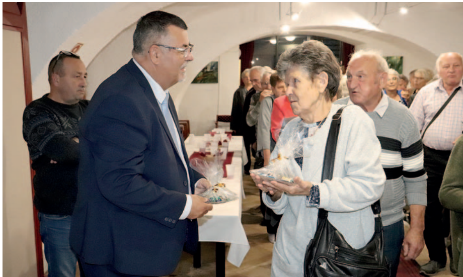
Az esemény végén az önkormányzat ajándékkal kedveskedett a szépkorúaknak.

Az Egyesült Nemzetek Szervezete (ENSZ) 1990. december 14-én szavazta meg, hogy október 1. legyen az idősök nemzetközi napja. Az október 5-ei eseményeket megelőzően Nyíri Tibor polgármester személyesen is köszöntötte a Tiszáninnyi Református Egyházkerület (TIREK) fenntartásában működő Szerencsi Idősotthon lakóit. Az október 3-ai eseményen jelen volt Koncz Zsófia, a térség országgyűlési képviselője, miniszterhelyettes, Pásztor Dániel püspök, Hajnal András és Balázs Pál lelkipásztorok. A beszédek sorát Pásztor Dániel kezdte, aki imát mondott az idősökért, szerinte nem csak most, hanem mindennap ünnepelelnünk kell őket. Hangsúlyozta, hogy az Istennek kortól függetlenül minden élet fontos. A püspök szerint nem szabad az idősöknek a szomorúságba merülni, erőt kell meríteni a hitből, el kell fogadni, hogy Isten szeret minket és életünk felül ő rendelkezik. Hajnal András egy személyes történetet mesélt el a hallgatóságának, ami a szépkorúak tiszteletére tanít mindenkit. Koncz Zsófia beszédében elmondta, hogy gyakran megfordul az otthonban, hiszen nagymamája ott lakik. Gyakran felidéz, hogy milyen sok szeretetet kapott nagyszüleitől, akiktől kitanulást, felelősség-tudatot és tiszteletet tanult. Nyíri Tibor szerint ebben a nehéz időszakban még többet kell segítenünk, a támogatásunkat nem csak szóban, hanem tettekben is meg kell mutatnunk. Szerencs Város Önkormányzata minden évben vásárlási