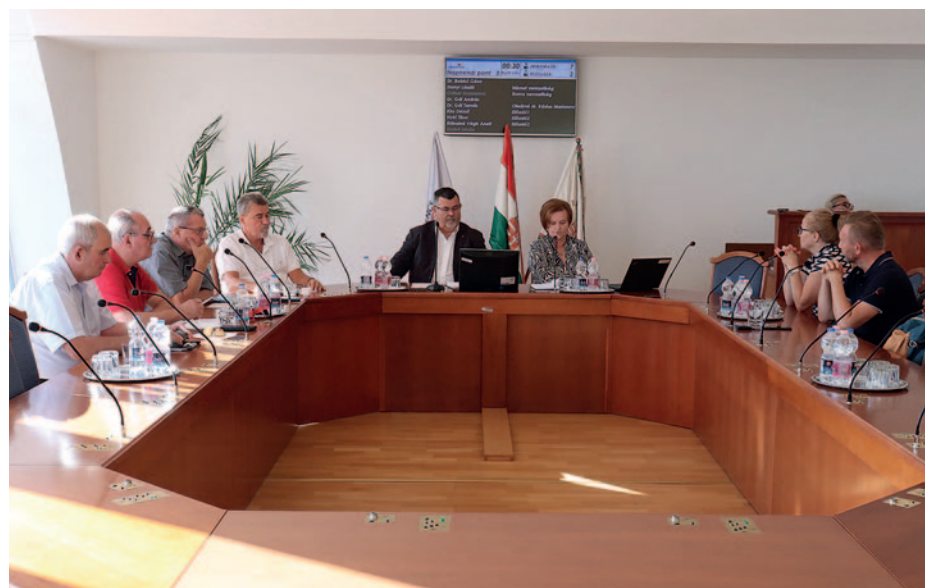
Újra összeültek a városvezetők.

Szerencs Város Önkormányzata szeptember 28-án tartotta soron következő ülését. A grémium döntött többek között a 2023. évi közmeghallgatás időpontjairól, elfogadta a városi óvodai munkatervet, a munkaszüneti és ügyeleti rendet, valamint a Bursa Hungarica Felsőoktatási Önkormányzati Ösztöndíjpályázat 2024. évi fordulójához való csatlakozást.