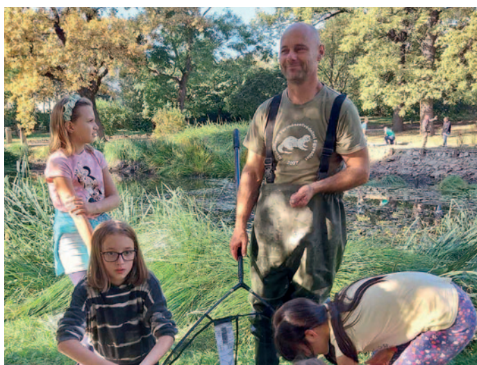
Mentették a békákat és halakat.

Szerkesztőségünk korábban már hírt adott róla, hogy megújul a Rákóczi-vár kertje. A tó sem marad ki, a vizet lecsapolják, az állatvilágot kimentik (teknősök, békák stb.), a medrét az iszaptól megtisztítják.