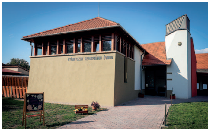
A Gyöngyszem Református Óvoda kívülről.