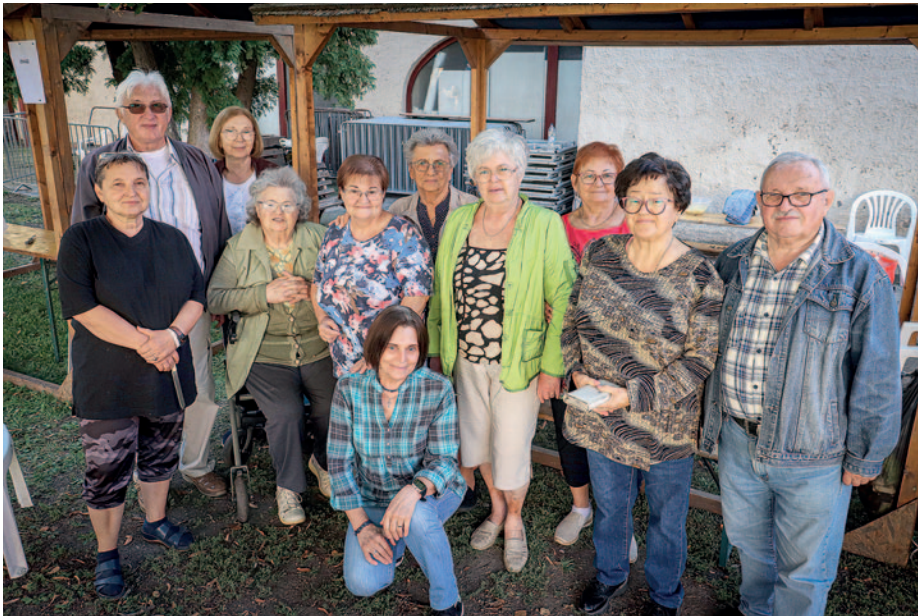
A főzőversenyt az „Öreg a nénikéd” Nyugdijas Klub csapata nyerte.