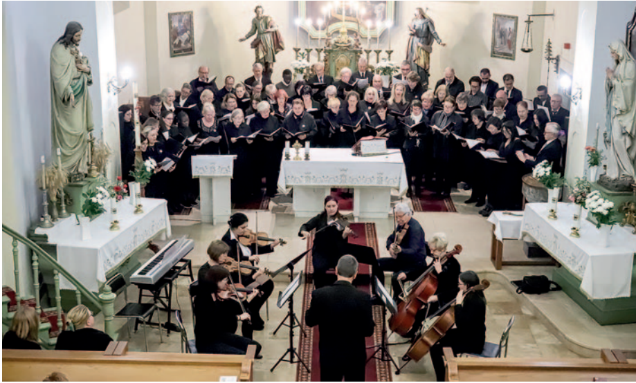
Az esemény közös énekkel zárult.

Giacomo Puccini: Requiem című műve is felcsendült október 21-én a Kisboldogasszony római katolikus templomban.