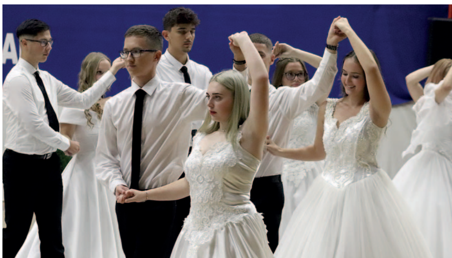
A táncok sorát, a hagyományoknak megfelelően a keringővel kezdték.