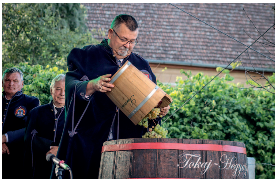
A polgármesterek jelképesen összeadták a szőlőt.

A Tokaj-hegyaljai Szüreti Napokat október 6–8. között rendezték meg, amely hazánk egyik legrégebbi szüreti eseménye, amit 1932 óta rendeznek meg. A céljai között a város kulturális hagyományának ápolása és a világörökségi terület sokszínű közösségi értékeinek bemutatása szerepel.