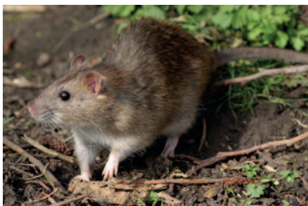
A rágcsálók akár fertőző betegséget is terjeszhetnek.

„Ezúton tisztelettel felhívom az ingatlantulajdonosok figyelmét, hogy a fertőző betegségek és a járványok megelőzése érdekében szükséges járványügyi intézkedésekről szóló 18/1998. (VI. 3.) NM rendelet 36. § (1) bekezdése értelmében a fertőző betegséget terjesztő vagy egyéb egészségügyi szempontból káros rovarok és egyéb ízeltlábúak, valamint a rágcsálók és egyéb állati kártevők megtelepedésének és elszaporodásának megakadályozásáról, távoltartásukról, rendszeres irtásukról gondoskodniuk kell” – adott tájékoztatást a címzetes főjegyző.