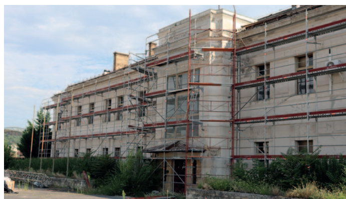
Az első ütem az épület állagmegóvására irányul.

A kivitelezés első üteme az állagmegóvás, melynek elsődleges feladata a beázás megszüntetése és a tető rendbetétele. A tervek szerint a felújított épületet az édességyártáshoz kapcsolódó szakképzés szolgálatába fog állni és a területre betelepülő vállalkozásoknak is tudnak biztosítani az első emeleten irodákat.