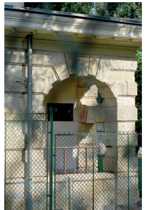
Az épület hátsó része is szépen kialakított.