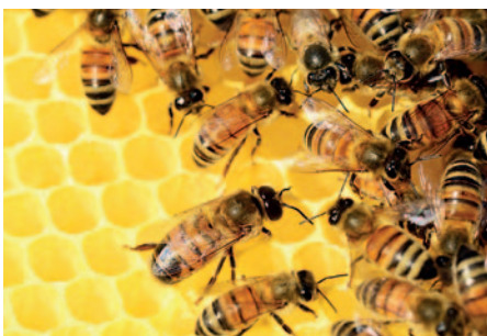
A beteg méhcsaládokat megsemmisítik. Képpünk illusztráció

Taktakenéz, Taktaszada, Taktaharkány, Mezőzombor települések közigazgatási területére