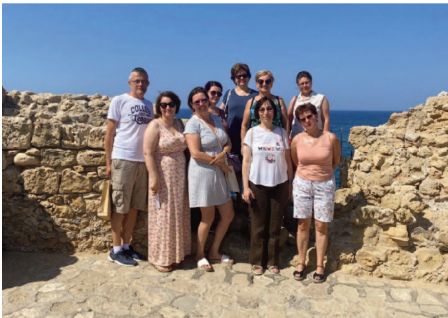
A szakmai látogatás résztvevői.

A résztvevőknek lehetőségük nyílt megnézni a helyi iskola épületét és konzultáltak informatikai ágazatban oktató tanárral is. A Paphosra érkező, szakmai gyakorlaton résztvevő diákok az iskola jól felszerelt tanműhelyében is meg tudják oldani a feladatokat. A szakmai menetrendet követően kulturális programon vehettek részt a pedagógusok. Ez utóbbiak között szerepelt a helyi archeológiai múzeum látogatása, megnézték az Unesco Világörökséghez tartozó templom freskóit, a belváros ősi épületeit és természetesen a Földközi - tengert.