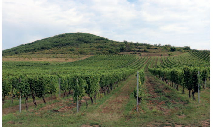
A Montium Borászat dűlője Legyesbényén.