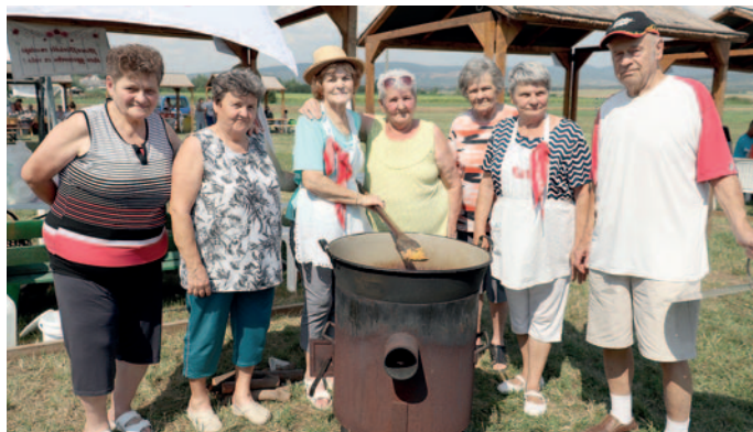
Az Ondi Idősek Klubjának főzőcsapata.