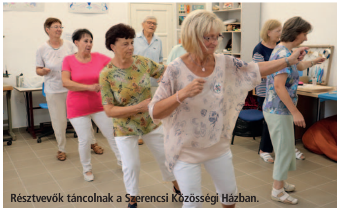
Részvevők táncolnak a Szerencsi Községi Házban.