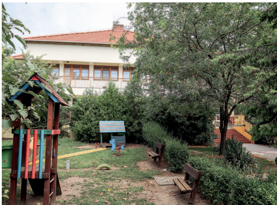
A Napsugár óvoda.

Szerencs Város Önkormányzata által fenntartott bölcsőde és óvoda elsősorban a helyben lakóknak kívánja biztosítani a magas szintű szolgáltatásokat, azonban szeretettel várják a városkörnyék településeiről is az állami intézmény iránt az érdeklődőket. „Az elmúlt évek átgondolt humán erőforrás gazdálkodásának köszönhetően szakdolgozóink munkahelye sem került veszélybe, tehát biztosított a foglalkoztatásuk. Úgy gondolom, hogy az óvoda nemcsak a családok és gyerekek számára nélkülözhetetlen, hanem Szerencs fejlődése szempontjából is elengedhetetlen, ami befektetés a jövő nemzedékbe és városunknak is hosszútávú előnyökkel szolgál” – hangsúlyozta a polgármester.