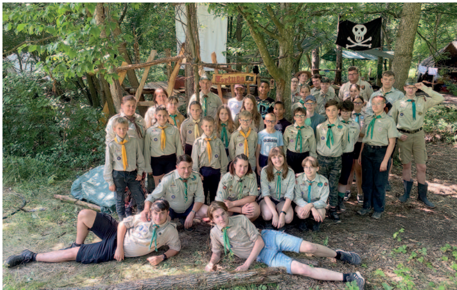
A kalóztábor Sárospaták mellett.