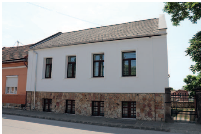
Fiataloknak készült az új önkormányzati lakás.