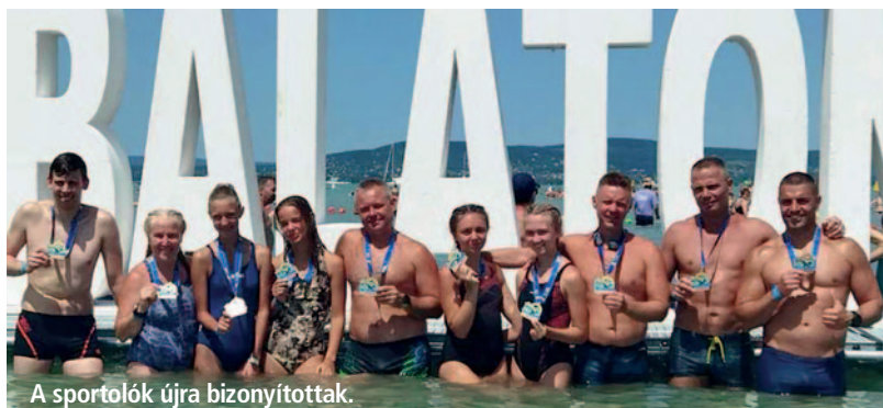
A sportolók újra bizonyítottak.