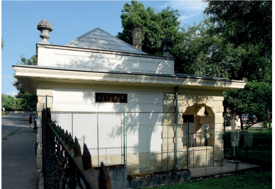
Az épület stílusa az eklektika és a szecesszió ötvözéséből jött létre.

Gondoljunk csak a mindennap látott bejárati portaépületekre a körforgalomnál, vagy a faragott kő kerítésre a vasútállomás felé menet. Ha ezeket a szép és nagy szakértelmet igénylő építményeket ma szeretné valaki megcsináltatni, annak vagyona kellene kifizetni érte. De gondolhatunk a sok igényes épületre is, a már