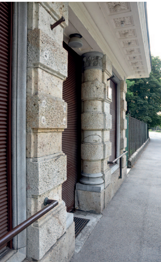
A gyönyörűen kialakított bejárat.