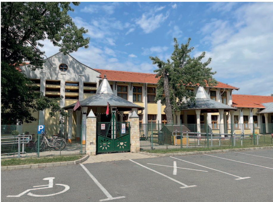
A Gyárkerti épület.

Szerencs Város Önkormányzata az állami támogatást kiegészítve biztosítja a Gyárkerti- és a Napsugár épületekben az óvoda működéséhez szükséges intézményi háttérrel, ahol felkészült óvodapedagógusok, dajkák és az őket segítő személyzet magas színvonalú nevelőmunkát végez. Elsősorban nekik köszönhető, hogy a szülők abban a tudatban mennek dolgozni, hogy gyermekük biztonságban és gondoskodó környezetben van. „Ondon is rendelkezésre áll az erre a célra a korábbi években felújított épület, azonban a szülők ott úgy döntöttek, hogy nem íratják ide a kicsiket, így a létszám nem érte el a csoport indításhoz a jogszabályban meghatározott minimumot. A lehetőség azonban to-