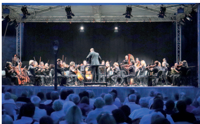
A Budafoki Dohnányi Zenekar már visszatérő vendégnek számít.

Az idei Zempléni Fesztivál húsz településen, ötven helyszínen és több mint ötszáz fellépő művésszel várta a szórakozni vágyókat augusztus 11-19-e között. Szerencsen a már visszatérő vendégek számító Budafoki Dohnányi Zenekar és a Seventeen Singers adott koncertet.