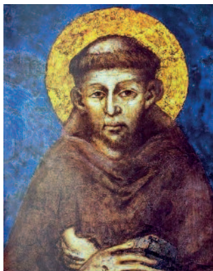
Ferencben mély tisztelet és csodálat élt Isten teremtett világát iránt.

Assisi Szent Ferencet választották védőszentjükül október 3-án a Bocskai István Katolikus Gimnázium és Technikumban. A dátum azért is különleges mert szintén ezen a napon volt a védőszent égi születésének napja 1226-ban. Az ünnepség Gasperné Tilman Edina igazgató beszédével vette kezdetét, aki kifejtette, nehéz feladat volt Bocskai István és Assisi Szent Ferenc között párhuzamot felfedezni, de végül sikerült. Hozzátette: mindketten találtak egy olyan célt, amelyben hittek, amely megvalósításáért köréjük egy közösség szerveződött és amik-