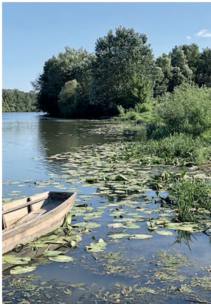
a kép címe: nyugalom.