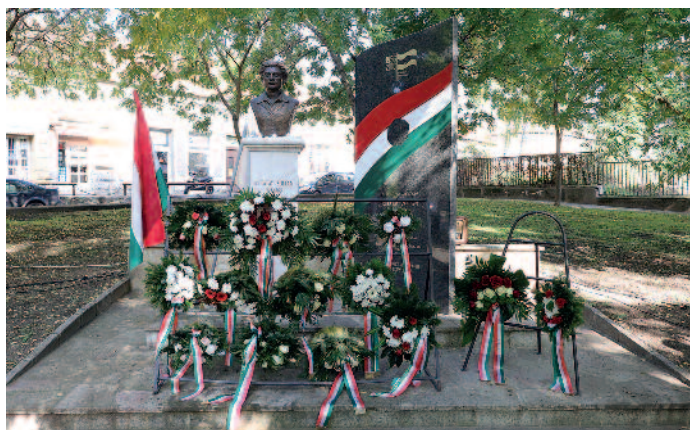
Szerencsen is méltóképpen megemlékeztek a forradalom hőseiről.