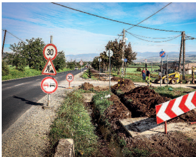
Az optikai kábeleket nagy teljesítményű adat és telekommunikációs átvitelre tervezték.

Manapság az internetszolgáltatók egyre csak növelik az elérhető maximális le és a feltöltési sebességet, amelyet azonban igen gyakran a régi rézkábelezés már nem tud kiszolgálni. Az elmúlt napokban a Magyar Telekom megkezdte Ond felé, a kerékpárút és a csapadékvíz-elvezető árok között fekteti az optikai kábelt, amellyel a jelenleg a legkorszerűbb, gigabites sáv szélességű szolgáltatások nyújtására alkalmas hálózatát építi ki. Ez a fejlesztés Szerencs egyes területeit érinti, továbbá Ond ellátását is szolgálja. Az otthoni gigabites internetnek elsősorban kényelmi előnyei vannak. Manapság már az interneten keresztül nem csak híreket olvassunk, de filmeket nézünk, zenét hallgatunk és játszunk is. Ha a család többi tagja egyszerre szeretné tenni, máris szükségesség válhat a gigabites sáv szélesség, amelynek éppen ez az egyik hatalmas előnye, hogy nagy mennyiségű adatot tölthetünk le/fel egyszerre, akár lakásunk több szegletében is. Erre a koronavírus-járvány első hulláma alatt sok háztartásban eszméltek rá, és sokan váltottak magasabb internet csomagra – ahol erre lehetőség volt – a gyorsabb netkapcsolat érdekében. Városunkban korábban csak egyes részeken volt elérhető a gyors gigabites internet, a Telekom beruházásával most újabb területeken válik elérhetővé az optikai kábel használata.