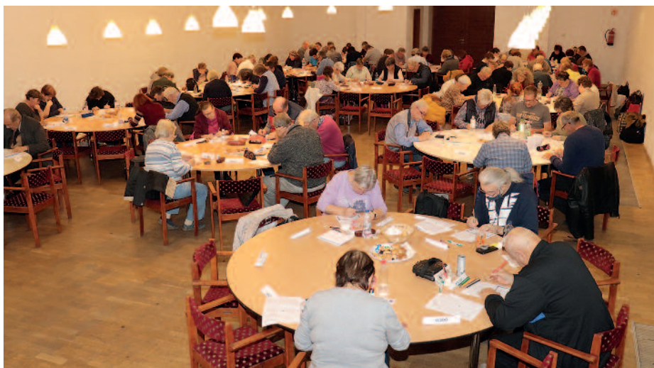
A kétnapos versenyre az ország minden pontjáról érkeztek játékosok.

A hagyományoknak megfelelően ismételt megrendezték szeptember 24-25-e között a Szerencsi Országos Rejtvényfejtő versenyt. A Rákóczi-vár színháztermében megtartott eseményt Skorván József, a szerencsi Logiklub elnöke nyitotta meg. Beszédében elmondta, hogy a verseny továbbra is rendkívül sikeres, hiszen több mint 260 fő érkezett a megméretetésre. Ezt követően Nyiri Tibor Szerencs polgármestere köszöntötte a megjelenteket. A városvezető kiemelte, hogy melegséggel tölti el szívét, amikor egy-egy esemény Szerencs hírnevét öregbíti. Hozzátette: az önkormányzat elkötelezett támogatója az Országos Rejtvényfejtő versenynek. Ezután Kasperek Éva, a Rejtvényfejtők Országos Egyesületének elnöke is köszöntötte a megjelenteket, majd ismertette a versenyszabályokat. Elhangzott, hogy a jelentkezők különböző kategóriákban indulhattak a megméretetésen: kezdő, haladó, mesterjelölt és mester. Az egyéni versenyzőkön kívül a csapatversenyre nevezőkre is vár-