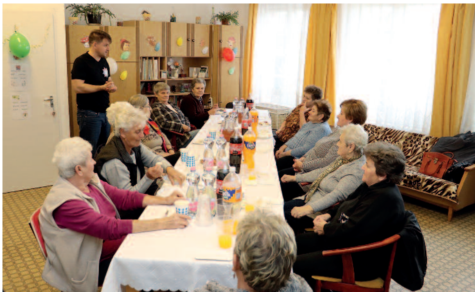
Igazi családi hangulat uralkodott az eseményen.