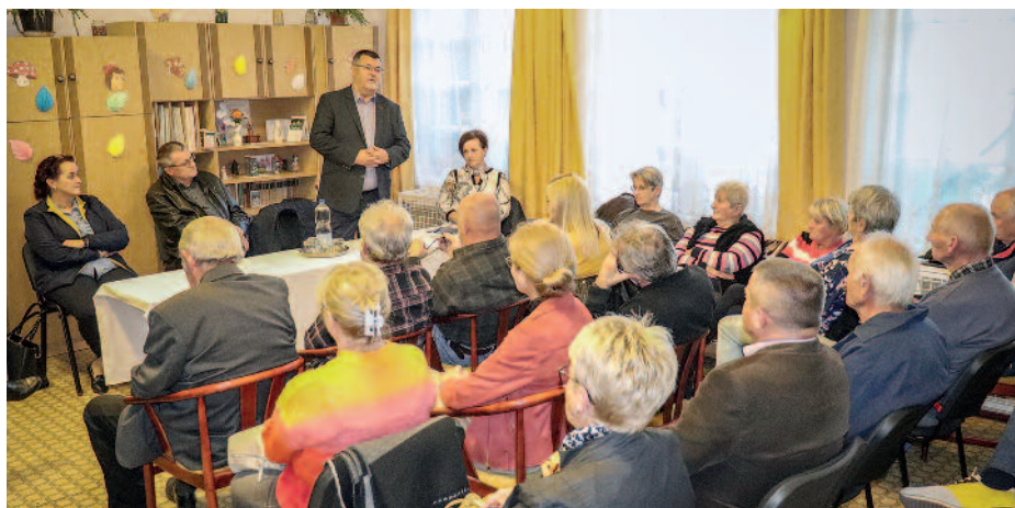
Ondon az idősek klubjában tartották a lakossági fórumot.