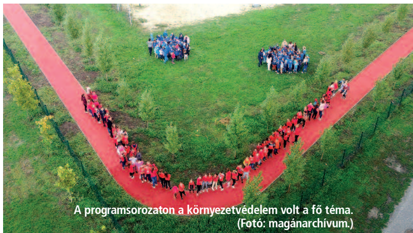
A programsorozaton a környezetvédelem volt a fő téma.

Bár a levegő színtelen, szagtalan, éltető gázelegy, a Tiszta levegőt! jelmondat hatására mégis arra törekedtek a hetedikesek, hogy megpróbálják lerajzolni, lefesteni a megfoghatatlant, felhívni a figyelmet a bennünket körülvevő levegő tisztaságának fontosságára. A Magyar Természetvédők Szövetsége megbízásából szintén a hetedikes tanulók az éghajlatvédelemmel