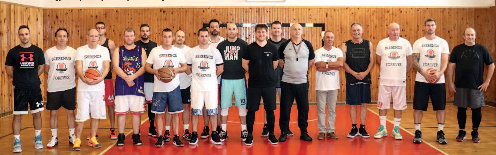
Évente egyszer újra és újra összejönnek a régi barátok és a kosárlabda szerelmesei.

A főszervező az eseménnyel – a kapcsolatok ápolásán túl – példát szeretne mutatni mindazon társaságoknak, akik már régóta nem találkoztak, de egykor szoros volt a kötelék közöttük. Egy jó sütésre, főzésre vagy akár egy sporteseményre mindig időt kell szakítani és energiát nem sajnálva meg kell szervezni a találkozót, mert felejthetetlen élményeket nyújt. „Az esemény nem csak nekünk fontos, de most már olyanoknak is, akiknek semmilyen kötődésük nincs a városhoz, mégis tiszteletüket teszik a találkozón. Erősen foglalkoztat a gondolat, hogy bővítsük a meccsek számát egy kisebb bajnoksággal, több korcsoport bevonásával. Jövőre, az ötödik találkozó talán már ilyen lesz – zárta gondolatait Kun Dávid.