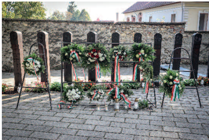
A jelenlévők elhelyezték a kopjafáknál az emlékezés koszorúit és mécseseit.

A kormány 2001-ben nyilvánította a magyar nemzet gyásznapijává október hatodikát, amikor az 1848-49-es forradalom és szabadságharc leverése után Aradon kivégzett 13 vértanúra – Aulich Lajosra, Damjanich Jánosra, Dessewffy Arisztidra, Kiss Ernőre, Knézych Károlyra, Láhner (Lahner) Györgyre, Lázár Vilmosra, Leiningen-Westerburg Károlyra, Nagysándor Józsefre,