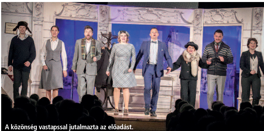
A közönség vastappsal jutalmazta az előadást.

Az előadást a szerencsi teltházás közönség vastappsal jutalmazta. Az esemény végén Szerencs Város Önkormányzata apró ajándékkal kedveskedett a résztvevőknek.