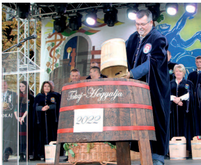
A polgármesterek jelképesen összeadták a szőlőt.

A programsorozat október 1-ei délutáni megnyitóján Szentkirályi Alexandra kormányzó elmondta: a szüret a különböző történelmi korokban mindig többet jelentett egyszerű munkánál, ünnepnek számított, hiszen egy évnyi munka gyümölcsét szüretelik le a termelők. „Aki szőlőt