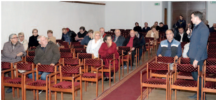
A közmeghallgatás szerencsi résztvevői.

nem tartja indokoltnak annak a fenntartását. A doktor telefonon történő bejelentésre a pácienseit az otthonukban vagy Szerencsen, a központi orvosi ügyelet épületében lévő rendelőjében látja el. A jelenlévőknek nem volt ellenvetésük ennek a megvalósítására.