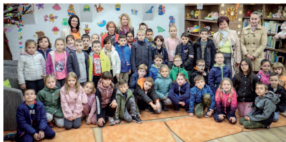
Az eseményen mindkét általános iskolából érkeztek diákok.

ben magát. A szülők sincsenek ezzel másképp. Nem mindig könnyű megfelelő választ találni a kisgyerek szünni nem akaró kérdéseire, oldani a félelmeket, megküzdni a mindennapok problémáival. A kötet verssel, mesével, sok szeretettel vezetgeti a főszereplőt, és segítségével még az olyan komoly témák is feldolgozhatóak, mint a halál, a betegség vagy az agresszió. A kedves, vidám alaphangulatú történetek arra hívja fel az olvasók figyelmét, hogy a nehézségeket nem lehet megúszni, de minden akadály legyőzhető. Az író pillanatok alatt kontaktust talált a fiatalokkal, nem véletlenül, hiszen a közkedvelt állatmesékre fókuszált, amit a szerencsi fiatalok is szeretnek. A programsorozat kézműves őszi játszóházzal és könyvtári órákkal folytatódott a Rákóczi-várban.