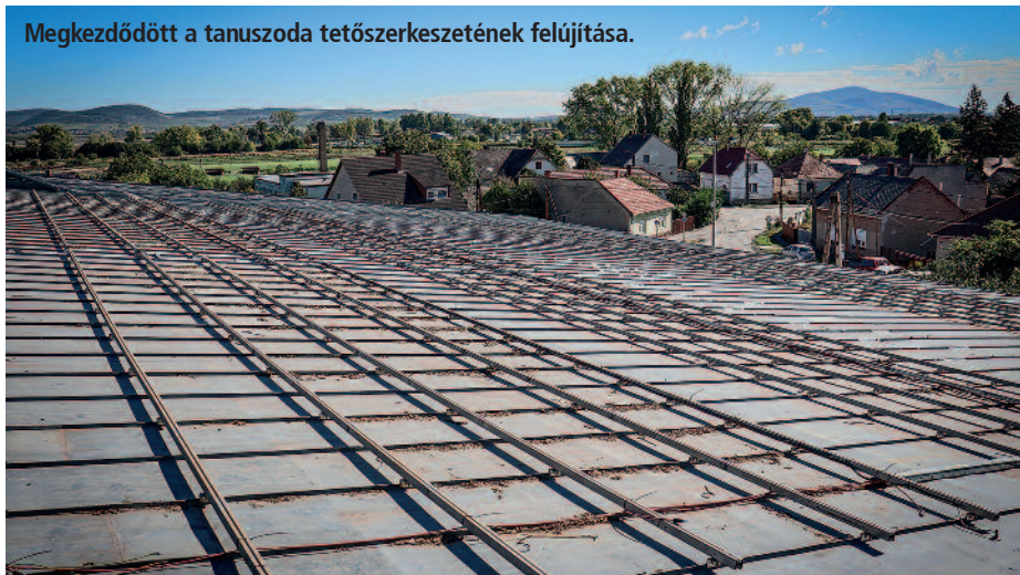
Megkezdődött a tanuszoda tetőszerkezetének felújítása.

Nonprofit Kft. a Kórház közt, mivel ennek a felújítását már nem finanszírozta a projekt.