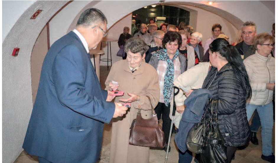
Az esemény végén az önkormányzat ajándékkal kedveskedett a szépkorúaknak.

Ezt követően Szabó Gergely, a Borsod-Abaúj-Zemplén Megyei Közgyűlés alelnöke ragadta magához a szót, aki elmondta, hogy a színházi est az „Identitás további erősítése Borsod-Abaúj-Zemplén megyében” című projekt keretében jött