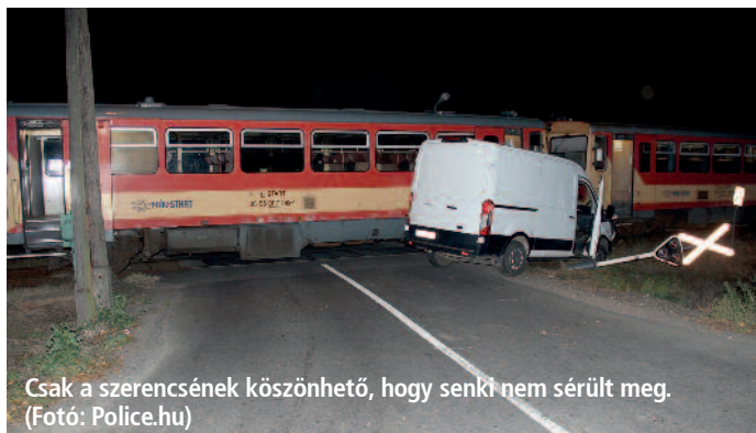
Csak a szerencsének köszönhető, hogy senki nem sérült meg.

A tűzoltókat október 15-én a Tállya határába riasztották. A Szerencsről Abaújszántóra 18:17-kor elindult 35218-as számú személyvonat Golop megállóhelynél a fénySOROMPÓS vasúti átjáróban haszongépjárművel ütközött. A fénySOROMPÓ piros jelzést mutatott. A balesetben senki nem sérült meg. A Szerencs-Abaújszántó közötti vonalon a helyszínelés ideje alatt a vonal teljes hosszán pótlóbuszok szállították az utasokat. A helyszínelést követően este 9 óra előtt a vonatforgalom újraindult. A vasúti