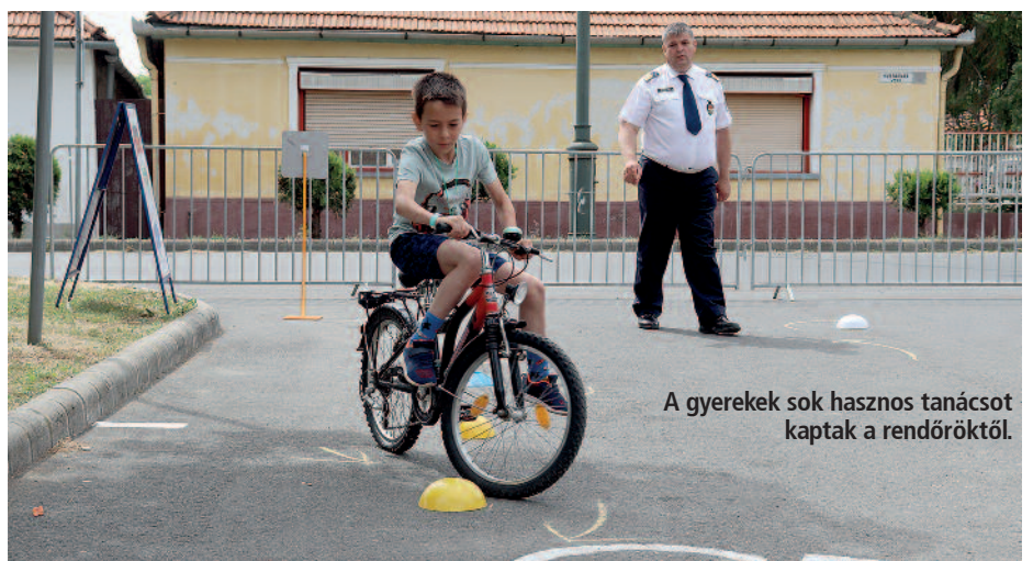
A gyerekek sok hasznos tanácsot kaptak a rendőröktől.

A Szerencsi Művelődési Központ és Könyvtár szervezésében gyermeknapot tartottak május 29-én a Rákóczi-vár kertjében. A belépés ingyenes volt és a kicsiket sok program várta, többek között arcfestés, hajfonás, csillámtetoválás, ugrálóvár, ügyességi versenyek, rejtvényfejtés, rajzverseny, gumikerekű kisonvat és állatsimogatás. Az idén népszerű volt a délelőtti futóverseny, ahol óvodások, valamint az alsó és felső tagozatos diákok álltak kategóriánként rajthoz. Minden résztvevő plüssfigurát és oklevelet kapott. Hasonló népszerűségnek örvendett a Szerencsi