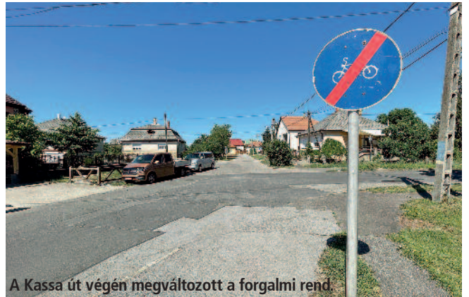
A Kassa út végén megváltozott a forgalmi rend.

Az elmúlt években több forgalmi rend változás történt Szerencsen a Kassa-Bányai-Csalogány utcák kereszteződésében. Miután a Rákóczi-iskola felől a Csalogány utcát egyirányúsították, a Bányai utca végére a lakó-pihenő övezet vége felé kikerült az elsőbbségadás kötelező háromszög. Ugyanezt a jelzőablát láthattuk a Kassa utcán a gyalogjárda mellett, a kerékpárúton, ennek a végét jelző tábla felett is, ami ugyan a bicajosokra vonatkozott, azonban a közúton haladóknak megtevesztő volt. Miután a Szerencsi Rendőrkapitányság az út kezelőjének a bevonásával helyszíni bejárást tartott, megszületett a döntés, és eltávolításra került a kerékpárút végéről a piros szegélyű háromszög, ami egyértelmű forgalmi szituációt teremt a kétkerékűvel közlekedőknek, valamint nem zavarja meg a Kassa utcán érkezőket. Érdemes óvatosan megközelíteni a kereszteződést és átgondolni a helyes áthaladási sorrendet, ha minden irányból esetleg egyszerre érkezik gépjármű, gyalogos és kerékpáros a kereszteződésbe.