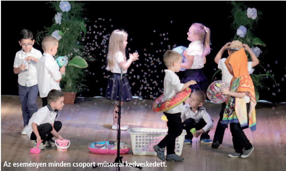
Az eseményen minden csoport műsorral kedveskedett.