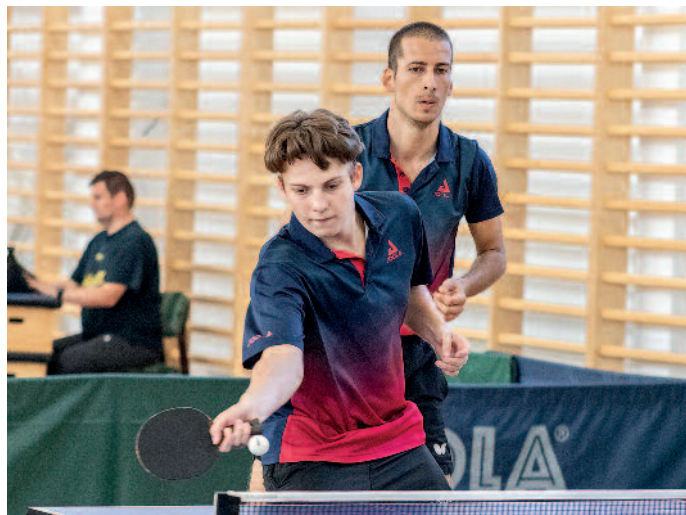
Képaláírás: Egyre több fiatal űzi a sportot.