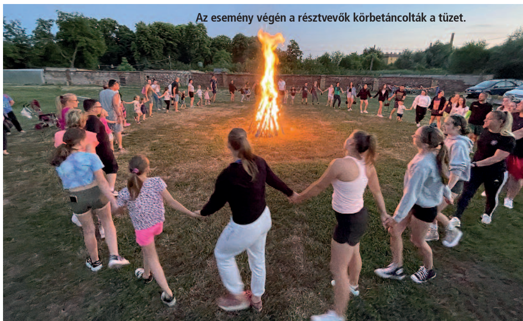
Az esemény végén a résztvevők körbetáncolták a tüzet.

megtisztulást az újjászületést jelképezte. A néphiedelem szerint kiválóan alkalmas varázslatok végzésére, de különösen a szerelemi kapcsolatok megerősítésére. Ilyenkor szokás a tűzugrás, amelyet a párok szoktak elvégezni az izzó páráz felett.