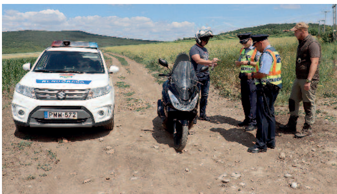
Gépi meghajtású jármű esetén csak engedéllyel lehet behajtani. Fotó: illusztráció

A tavasz beköszöntével településeink külterületein, dűlőútjain, valamint a környékbeli erdőkben megjelentek a gépi meghajtású hobbi célból használt járművek, enduro motorkerékpárok, quadok. A gépjárművekkel történő közlekedés során azok vezetői több esetben figyelmen kívül