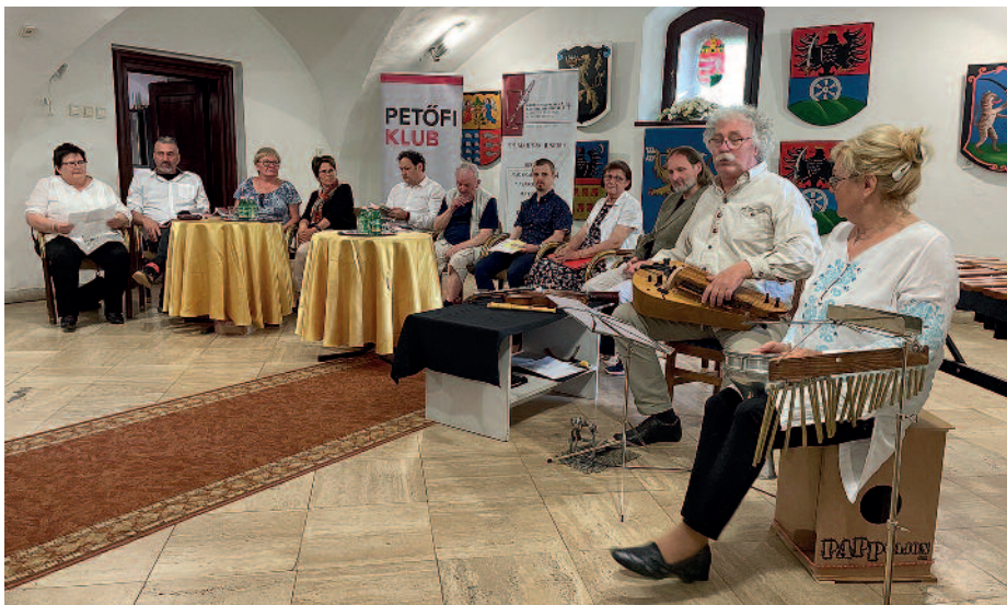
Szerencsen az irodalom szerelmeseit kortárs magyar és külföldi költők fogadták.

Immár második alkalommal rendeztek május 30. és június 4-e között a Rimay János Alapítvány szervezésében nemzetközi irodalmi találkozót, a Kárpát-medencei és V4 Költészeti Fesztivált. Az országosan egyedülálló költészeti ünnepség során a Kárpát-medence magyar aj-