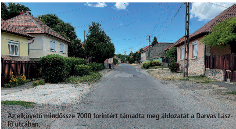
Az elkövető mindössze 7000 forintért támadta meg áldozatát a Darvas László utcában.

Rablás büntett elkövetésének megalapozott gyanúja miatt folytat eljárást a Szerencsi Rendőrkapitányság egy 22 éves helyi férfival szemben. A gyanúsított 2022. június 12-én 22 óra körül Szerencsen, a Darvas László utcában megfenyegette áldozatát, ha a sértett nem ad neki pénzt, akkor „szétveri a fejét”. A férfi félelmében, és testi épsége védelme érdekében hagyta, hogy az útonálló a zsebéből elvegye közel 7000 forintját. A bejelentést követően a rendőrök rövid idő alatt azonosították, elfogták, majd a rendőrkapitányságra előállították a bűncselekmény elkövetésével megalapozottan gyanúsítható férfit, aki kihallgatásán beismerő vallomást tett. A Szerencsi Rendőrkapitányság a támadóval szemben előterjesztést tett letartóztatásának ügyészi indítványozására.