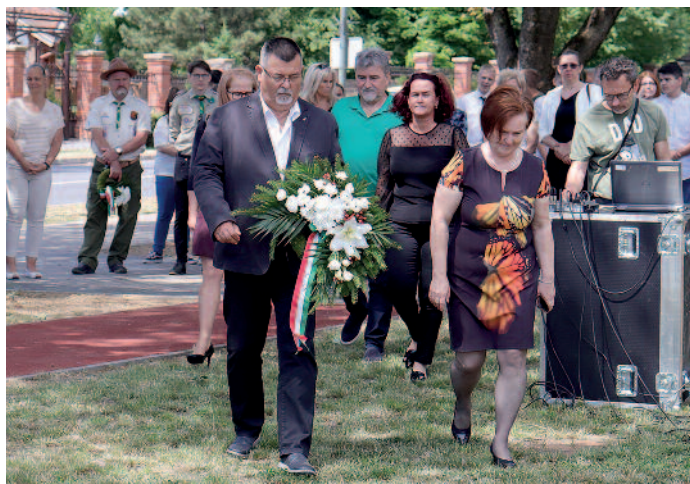
Az esemény végén a képviselők megkoszorúzták az emlékművet.

A magyar hősök napja alkalmából tartottak megemlékezéseket május 27-én Szerencsen és Ondon. Az elesett magyar hősök emlékezetét először 1917-ben iktatták törvénybe, az emléknap erre az évre vezethető vissza, ekkor már a végéhez közeledett az első világháború. Ekkor mondták ki először, hogy nemzetünk hősi halottainak kegyeletteljes tiszteletét megfelelő módon kifejezésre kell juttatni. A kommunista Magyar-