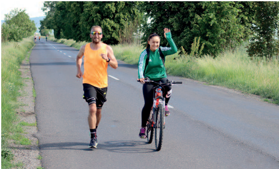
Volt aki futva és volt aki kerékpárral teljesítette a távot.

Ötödik alkalommal rendezték meg május 28-án a Rákóczi fejedelem tiszteletére a Körömi Rákóczi Emlékfutást. Köröm településen úgy tartják, hogy azt az országgyűlést, amelyet II. Rákóczi Ferenc fejedelem Ónodra hívott össze 1707-ben, végül a sajkóköromi (Köröm régebbi