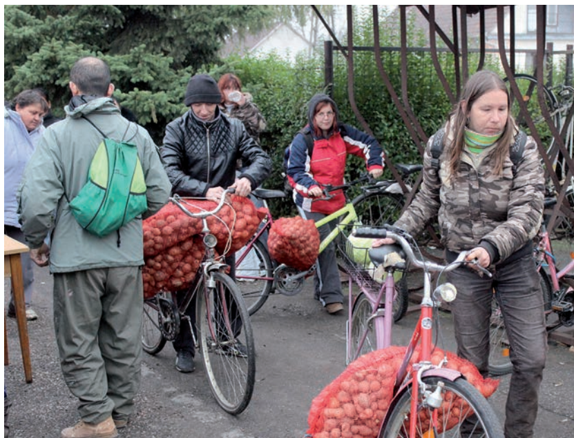
Egy zsák burgonyát és két fej káposztát vihettek haza a jogosultak.