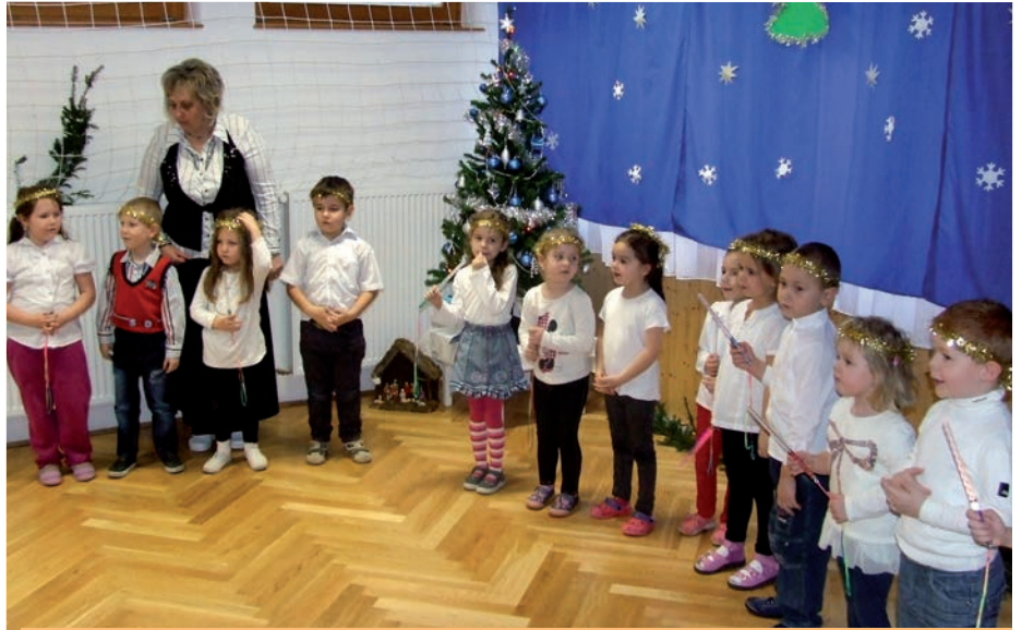
Az óvodások is nagy izgalommal készülnek a szeretet ünnepére.

A karácsonyvárás az egyik legszebb időszak az évben, a készülődés izgalma még erősebbé teszi az ünnep fényét. Már novemberben elkezdjük a ráhangolódást, hiszen nyelvi gálát szervezünk a hálaadással kapcsolatban. A népi hagyományörzés jegyében a jeles napok köré csoportosítottuk a rendezvényeinket. Az alsó tagozatosoknak adventi játszótérrel szervezünk, forgószínpad-szerűen különböző tevékenységeket lehet majd kipróbálni a koszorúkészítéstől kezdve az apró ajándékgyártáson keresztül a csomagolástechnikák elsajátításáig. A karácsony közeledtével a felső