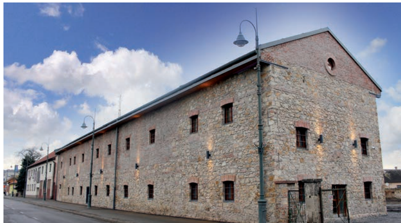
A szerencsi édességyártás szolgáltatásban marad a régi épület.