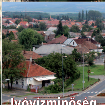
Ivóvízminőség -javító beruházás

XXIX. évfolyam 13. szám • 2014. augusztus 22.