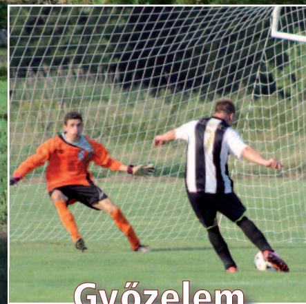
Győzelem a Magyar Kupában