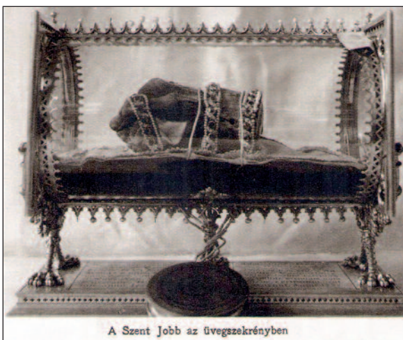
A Szent Jobb az üvegszekrényben

Városunkban is évszázadokon át megemlékeztek Nagyboldogasszony napján István királyról, aki fejére ezen a napon tette II. Szilveszter pápa küldötte a koronát. A 20. század elején évről-évre változott, eléggé vegyes érzelmekkel társult az ünneplés. Kezdetben a keresztény hit és a hazaszeretet a legszebb harmóniában olvadtak össze e napon.