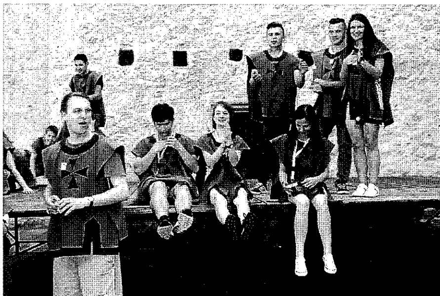
A gyerekek birtokba vették a szerencsi Rákóczi várat

a városi könyvtárba is ellátogattak. Az este folyamán a Szikra Tánciskola évvégi gálaműsora szórakoztatta az Europart résztvevőit.