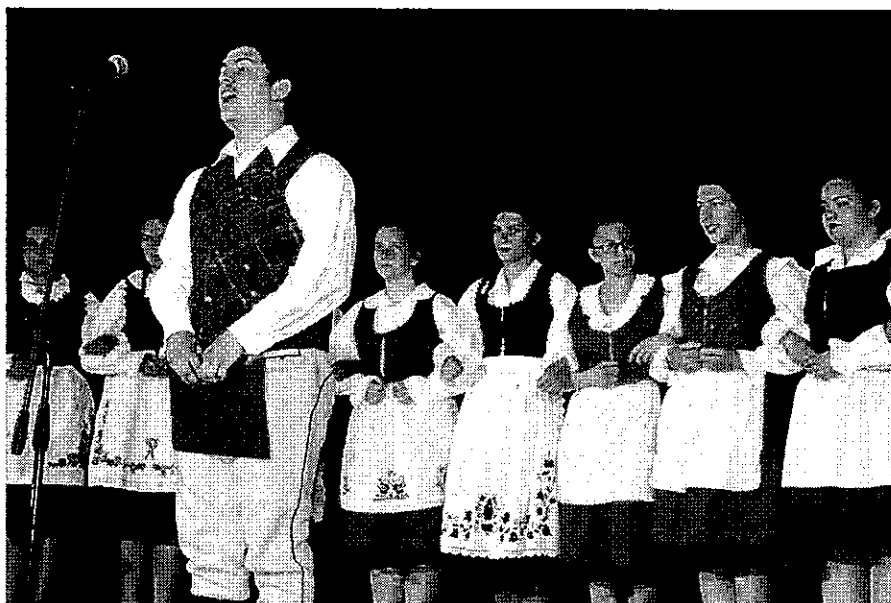
Gálaműsor a szerencsi Rákóczi várbán